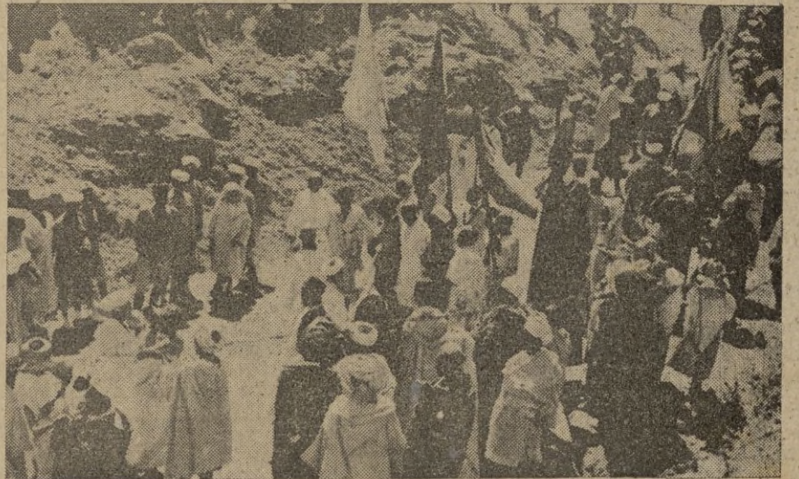
Los "hamachas" en sus típicos bailes.