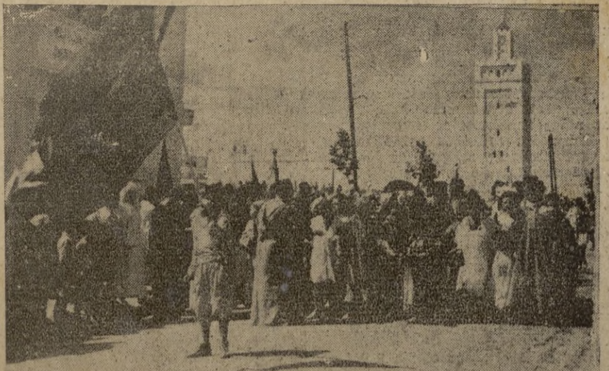
Los componentes de la escuela musulmana del Príncipe.