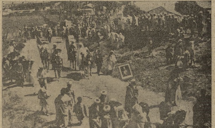
La presidencia de la Romería al frente de la cual iban dos hermosos re tratos de S. E. el Caudillo Franco, y de S. A. I. el Jefe.