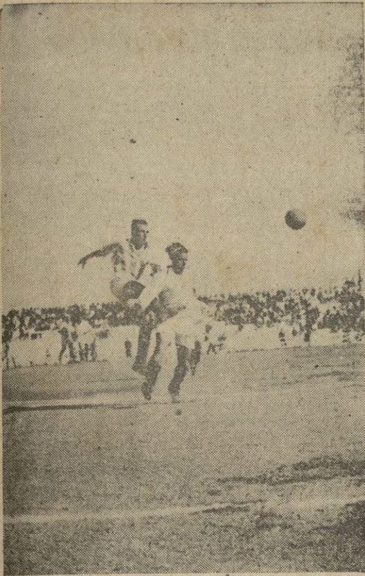
El defensa izquierda del Juventud Deportiva, en un alarde de acero bacia, quita a Rufo ocasión de marcar.

El porvenir de Noruega me- ridional depende de la ac- tual batalla al sur de Tron- dheim, dicen los ingleses