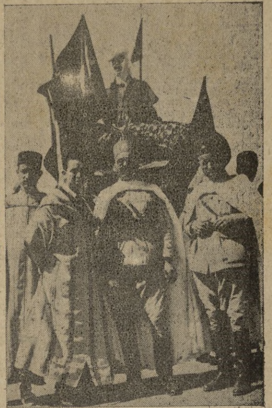
La carroza automóvil en la que iban las ofrendas