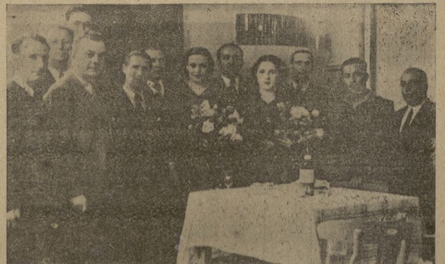
La directiva del Ceuta, en el acto de la inauguración de su domicilio social, obsequia con hermosos ramos de flores a dos bellas damas melillenses

Número premiado en el sorteo de ayer el 67.