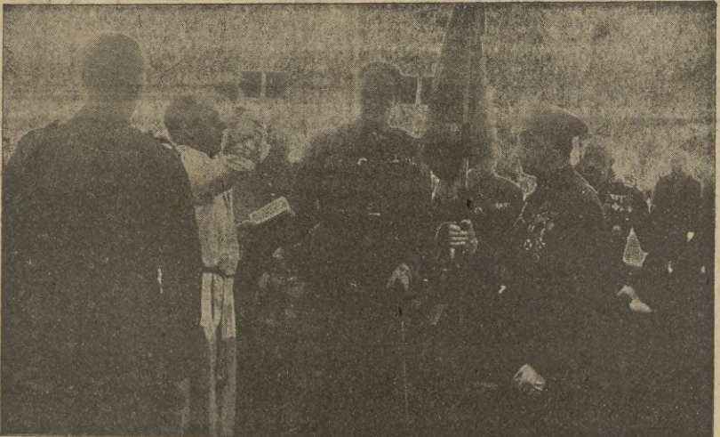
Acto de bendición del nuevo Estandarte, celebrado en la mañana de ayer y que revistió gran solemnidad.