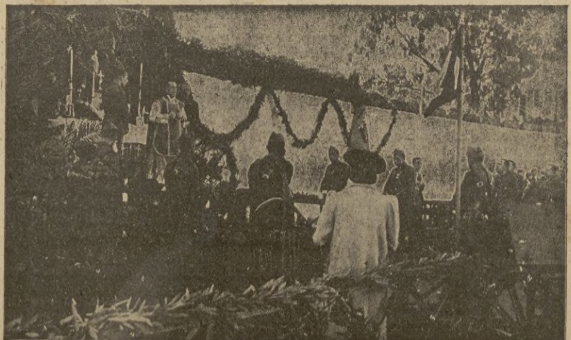
La misa de campaña celebrada en el Cuartel de Artillería

La Capital del Protectorado festejó con gran fervor la solemnidad de la Patrona de la Artillería, Santa Bárbara. Por añadidura, hizo un día espléndido, que contribuyó a dar brillantez a la fiesta.