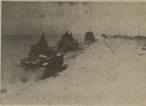
Carros de combate italianos, en el desierto marmárico.