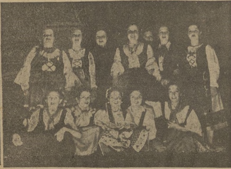
Las primeras figuras femeninas de la Compañía de Andrés Calvo. -- Principales intérpretes caracterizados aún de su intervención en Katiushka.