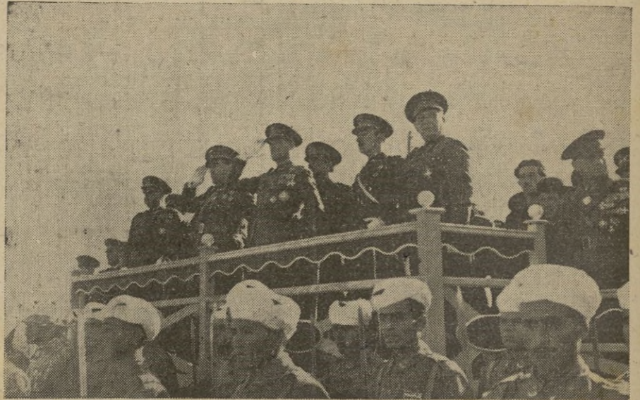
Presidencia del solemne acto celebrado en el muelle "Dato"