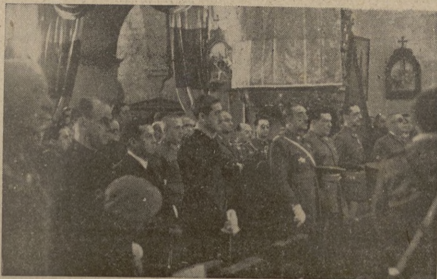
Presidencia del solemne acto religioso celebrado por los infantes.

Añade que los marinos ingleses se bieron a bordo del buque, apagando el fuego. Después arriaron la bandera alemana e izaron la inglesa. — EFE.