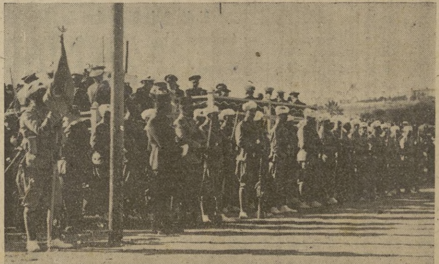
Grupo de soldados supervivientes de I Tabor que mandaba el señor Zamalloa en el Pingarrón.

El templo severamente adornado, fué ocupado por las autoridades civiles y militares, así como representaciones de todos los cuerpos. Numerosísimas personas se sumaron a este acto que resultó en extremo emocionante.