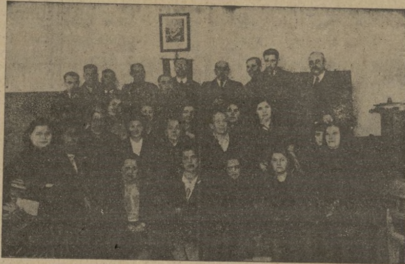
Grupo de maestras y maestros que asistieron el domingo al acto de reparto de prendas celebrado en el Grupo Escolar de Lope de Vega