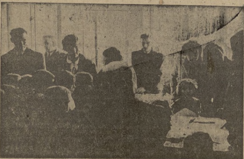
Grupo de niños esperando el regalo.

Hasta aquí lo que podemos hoy anticipar. Mientras tanto puede el público seguir admirando las exposiciones que tenemos por ahora en los escaparates de CASA MOLINA EL HOGAR MODERNO CASA IBÁÑEZ