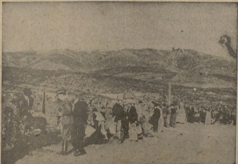
Tetuán. -- Una gran hilera de alumnos y profesores de todos los centros escolares y del Frente de Juventudes plantando sus correspondientes árboles

Alcalá de Henares, 23. — Uno de los asesinos que dirigieron las matanzas del tren de la muerte, apodado "El capitán de los cinco diablos", con domicilio en el Fuente de Vallecas y autor además, de muchos crímenes cometidos durante la dominación roja, ha sido detenido por elementos de la Delegación comarcal de Información e Investigación, y por la Guardia civil.