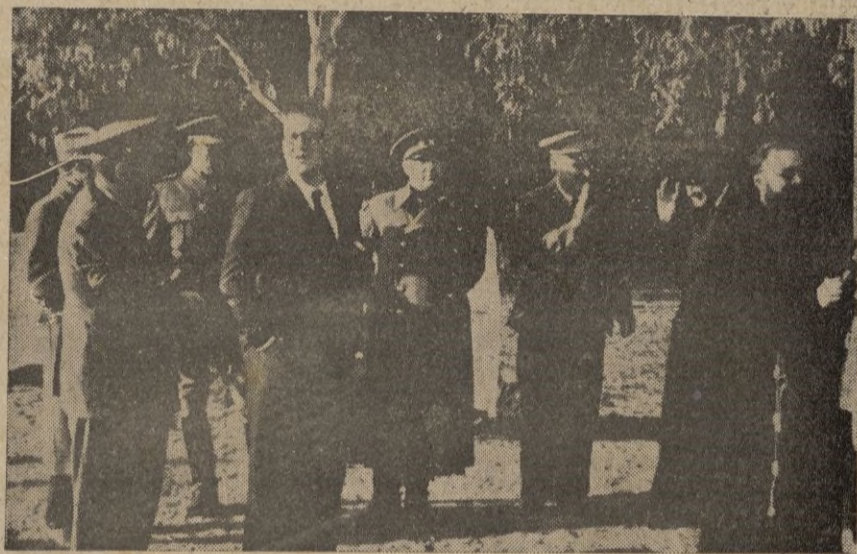
Larache. -- La Fiesta del Arbol. -- Grupo de autoridades que presidieron el acto.