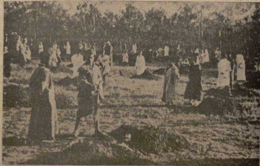
Larache. -- Una escuela musulmana ante el nuevo árbol antes de la plantación.