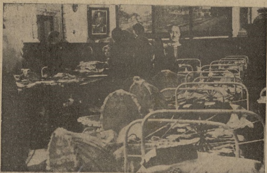
Ceuta. -- Camas y cunitas que fueron repartidas en el día de ayer.