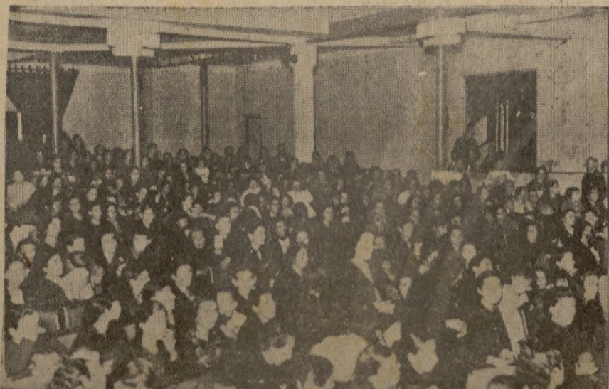
Ceuta. -- Un aspecto de la Sala del Teatro Cervantes.