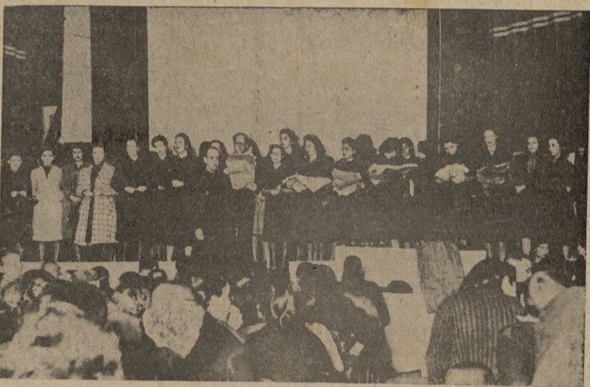
Ceuta. -- El Secretario del Movimiento, Jefe de Propaganda y Delegada de la Sección Femenina en el escenario en el momento de efectuar la entrega de los objetos expuesto en el Salón del Hogar de Falange.