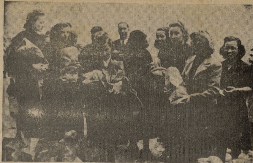
Ceuta. -- Momento de hacer la entrega de bolsas a varias beneficiadas.