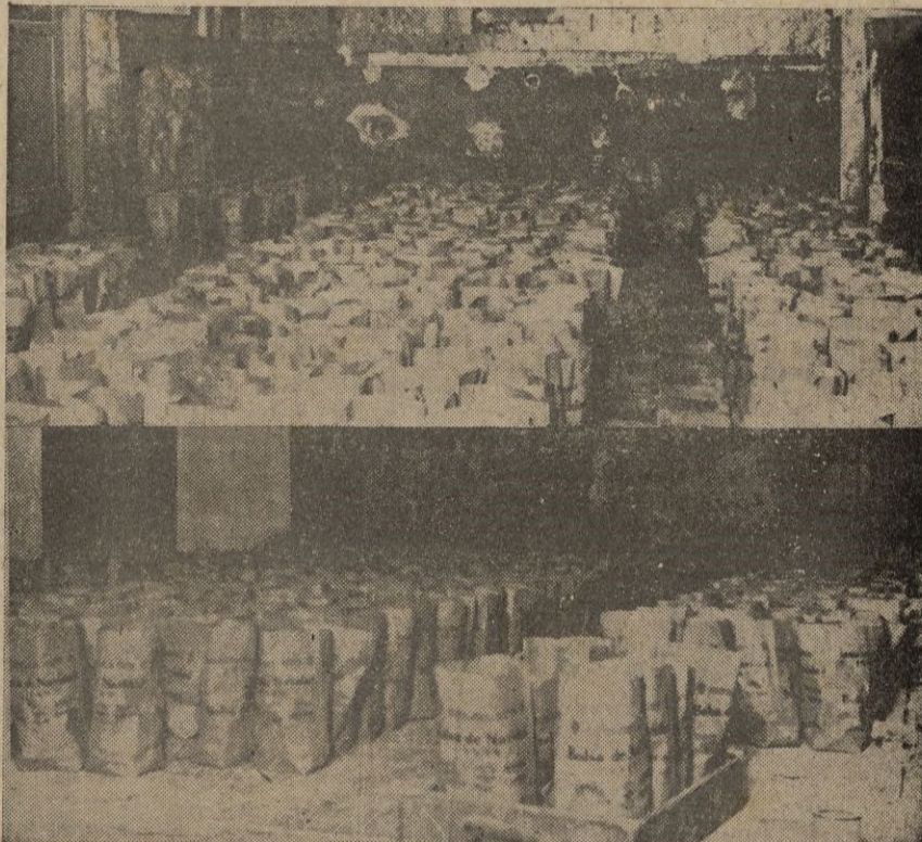
Ceuta. -- Las bolsas repartidas por la Sección Femenina preparadas para su entrega.