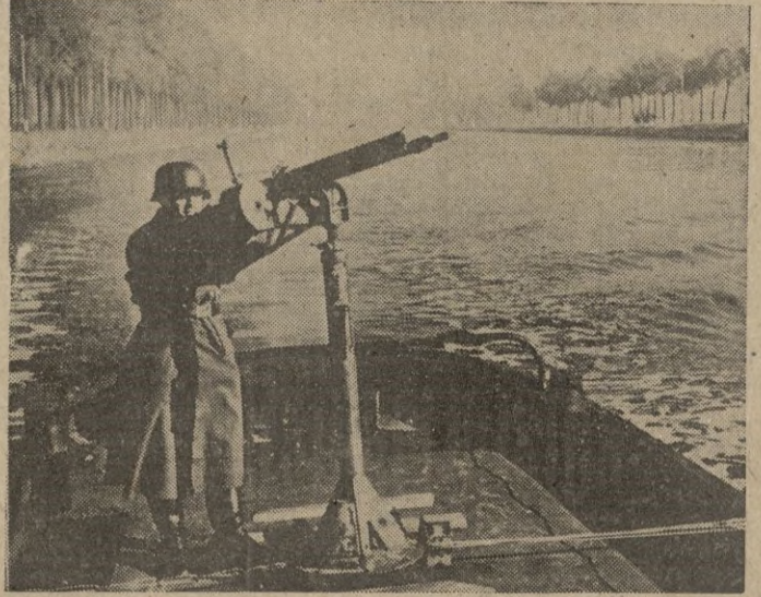
Los grandes canales de Flandes están protegidos por antiaéreos ligeros montados en pequeñas barcas rápidas.