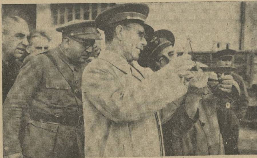
Autoridades, Jefes y oficiales del Aerodromo y jerarquías de Falange examinando uno de los bellísimos juguetes construidos.

—¡Del comandante Bazán! — nos contesta—. Ya el año anterior la inicié y se vió cristallizada con buenos juguetes. Este año, hace ya algún tiempo, nos la sugirió de nuevo. Como un solo hombre contestamos todos afirmativamente y al proponernos que las horas empleadas serían canjeadas por las de prestación obligatoria al Estado, le rogamos encarecidamente que este tiempo lo iríamos cumpliendo con forme está ordenado, pero que el tra-