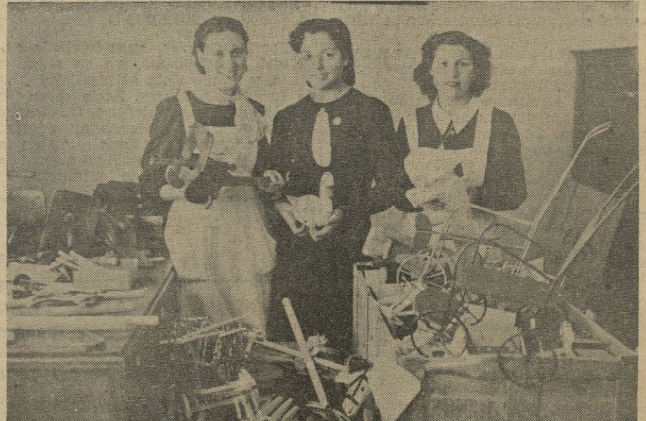
Legión de chicas como estas, de Auxilio Social, dieron realidad al noble gesto de los obreros de Aviación.