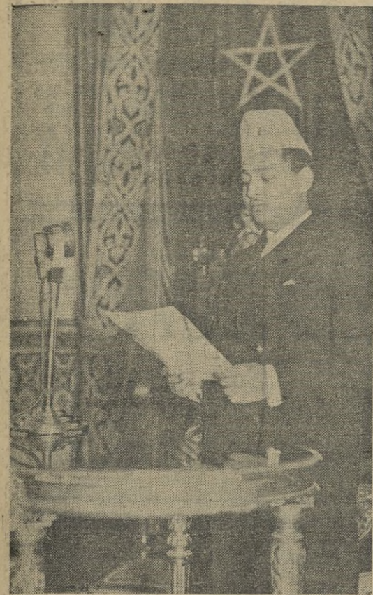
Aparece en esta interesante "foto" el joven príncipe marroquí leyendo su discurso ante el micrófono que, conectado con Radio Nacional de España, difundió el día 4 del actual, su autorizada palabra por el mundo, al iniciarse las emisiones en lengua árabe.

Y para que conste, extendemos la presente acta en Madrid, a veintinueve de Diciembre de 1939. -- Año de la Victoria. -- Ramón Serrano Suñer. -- Pedro Gamero del Castillo. -- Eugenio D'Ors. -- Wenceslao Fernández Flores. -- Javier M. de Bedoya. -- Francisco de Cossio. -- Manuel Aznar.