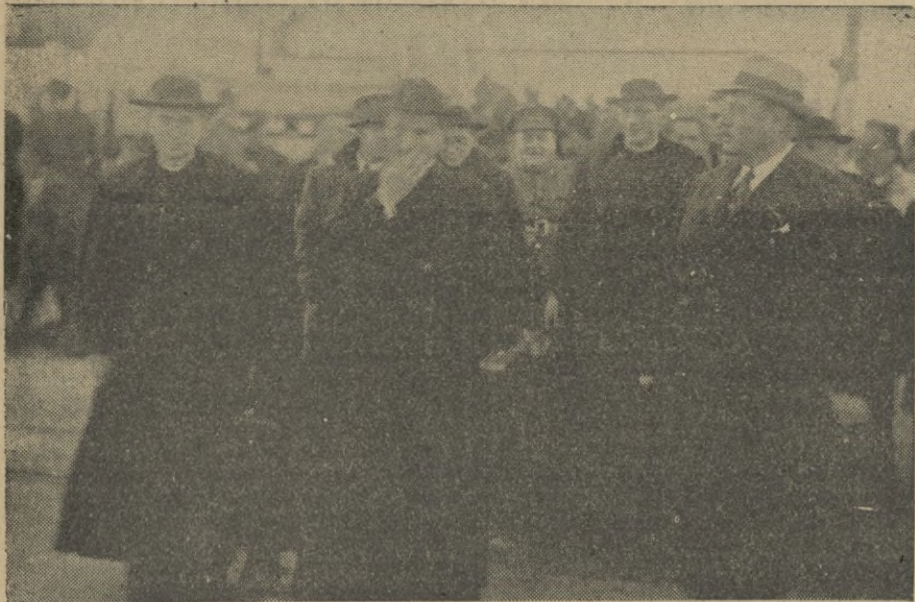
Acompañados de las personalidades que les recibieron, los ilustres profesores Agustinos, se dirigen a los coches.

Son recibidos por S. E. el Secretario General de la Alta Comisaría