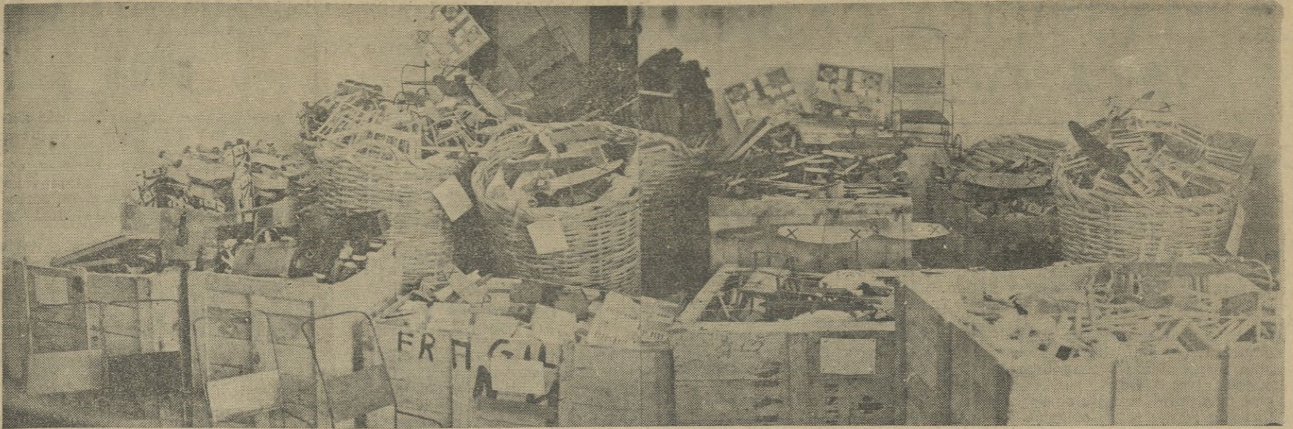
ASPECTO DE UNA SALA, EN QUE SE HAN IDO CONSERVANDO LOS JUGUETES, YA CLASIFICADOS.