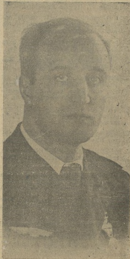
El Comandante Bazán, alma de niño y corazón de gran hombre, muerto por Dios y por España. ¡PRESENTE!