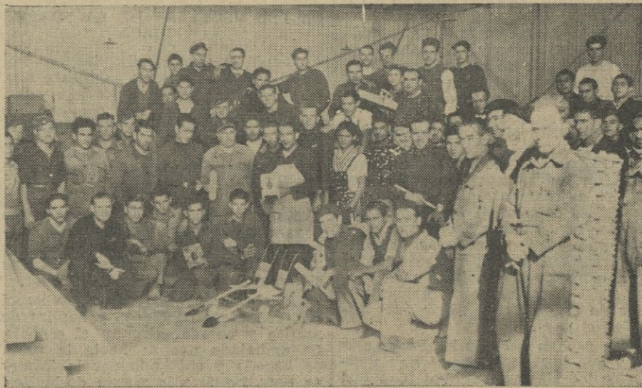
He aquí a los obreros que dando un alto ejemplo de altruismo han tenido a su cargo la confección de los juguetes.

dimos de jefes y subalternos, con la impresión gratisima de haber respirado un aire tan español y tan patriota, que de ningún modo queremos se nos escape.