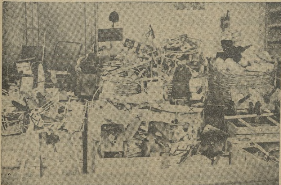
En esta otra, puede apreciarse la variedad de juguetes que ya a estas horas están siendo delicias de los pequeños.

(Más información de Tetuán en la página siguiente).