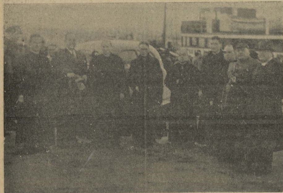
Antes de partir para Tetuán, posan ante nuestro compañero Cabrera Guadarrama.

Conforme anunciamos en edición anterior, en el vapor correo de ayer llegaron a nuestra ciudad muy relevantes personalidades, pertenecientes a la sección de Árabe de la Universidad Central.