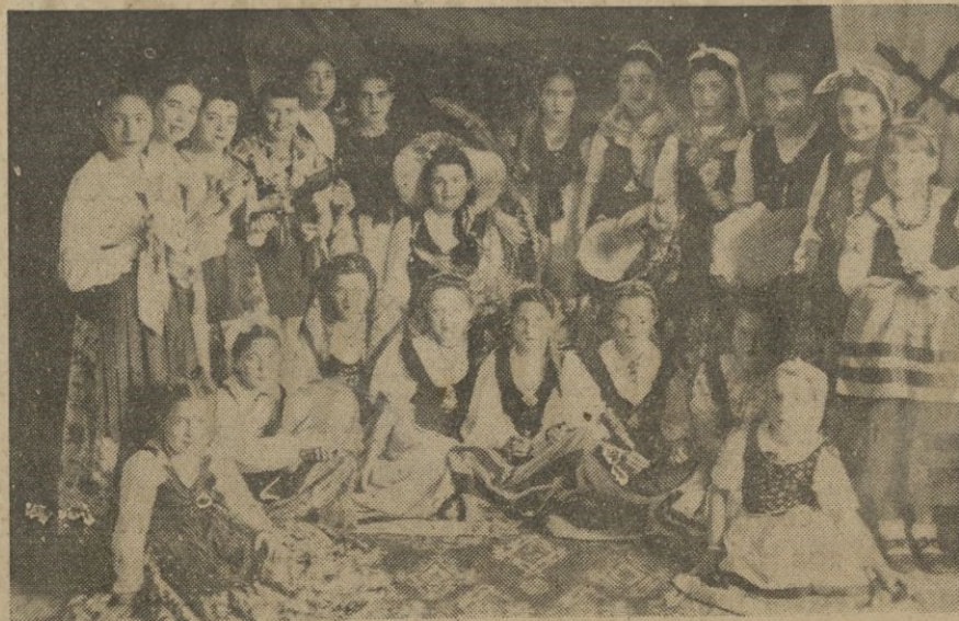
Coros de afiliadas a la Sección Femenina que interpretaron preciosos villancicos en distintas carrozas de las que formaron en la tradicional cabalgata.

Las beneficiadas fueron pasando y al mismo tiempo que presentaban el