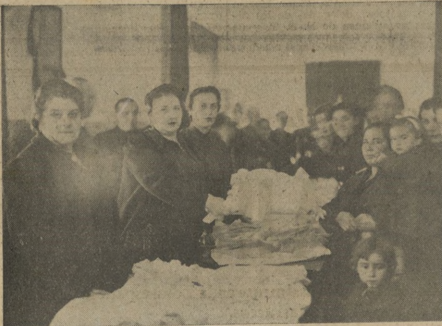
La excelentísima señora de Asensio en el momento de hacer entrega de una canastilla

Seguidamente y por la Excelentísima señora de Asensio, se comenzó la distribución.