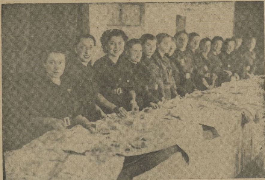
Señoritas de la Sección Femenina con su Delegada Provincial, momentos antes de iniciarse la distribución de las canastillas

En la mañana de ayer fueron distribuidas en la Sección Femenina numerosas canastillas tanto para las que han poco dieron a luz como para aquellas que su estado anunciaba un próximo alumbramiento.