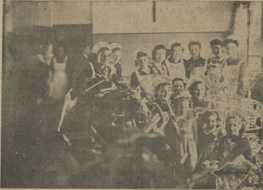
Eternamente sonrientes -- la ardua tarea no hace mella en estas chicas de Auxilio Social -- posan rodeadas de juguetes

Tetuán ha saludado y ha despedido a los Reyes Magos cuajada en un ambiente de incomparable sensación. Tuvo su culminación al encenderse las luces del cortejo que encendía chispas saltarinas en las mentes infantiles. Tetuán se ha conmovido en un entusiasmo ingenuo, lleno de luces y de músicas, de chiquillos en la calle, muchos chiquillos, que han corrido cien veces la ciudad; llena de gente presurosa y por todas partes regocijo. Sobre las alturas de Regulares ha estado brillando la estrella simbólica, con su cola de fuego, conductora de los Magos. Un cometa permanente en nuestro pensamiento católico.