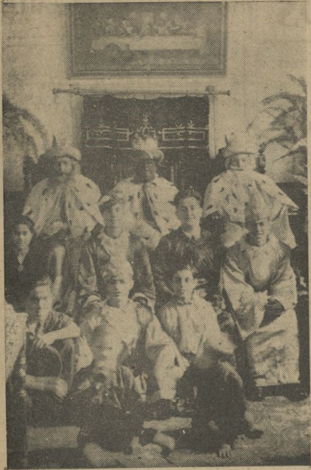
Los Reyes Magos y su corte en el Asilo de An- cianos y Huérfanos.