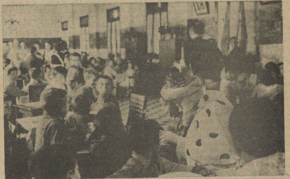
A la una de la tarde se trasladaron al Comedor del Príncipe, donde repar- tieron igualmente abundantes juguetes.