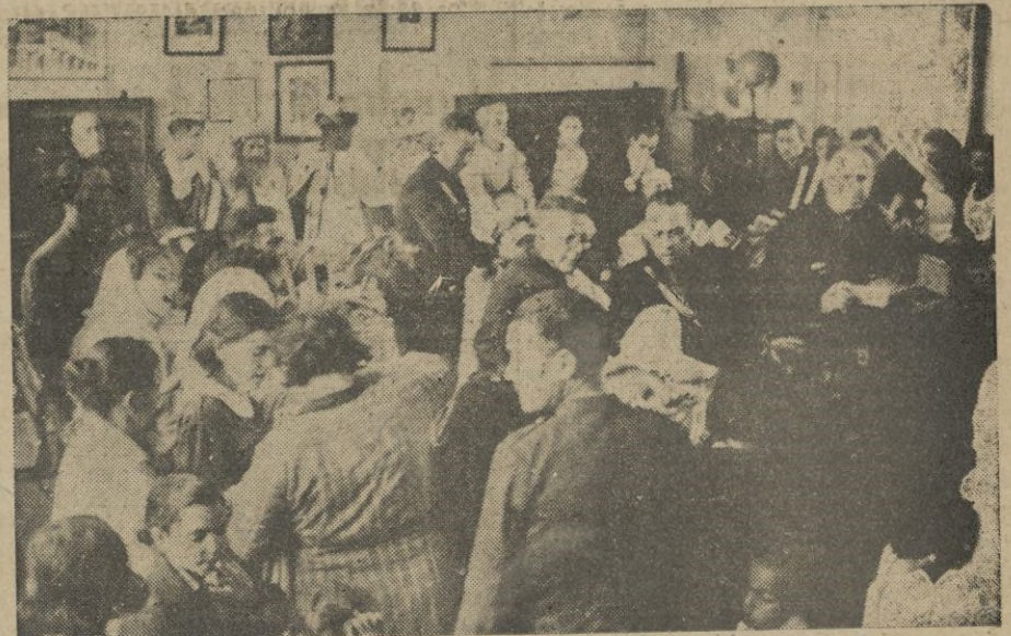
Y por último en peregrinación magnífica — postulado hermoso de la Falan- ge — se trasladan con su preciosa carga, hasta la apartada barriada de Ben zú.