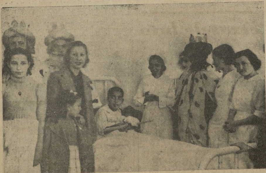
Y de allí se trasladan al Hospital de la Cruz Roja, donde agasajan a los enfermitos...