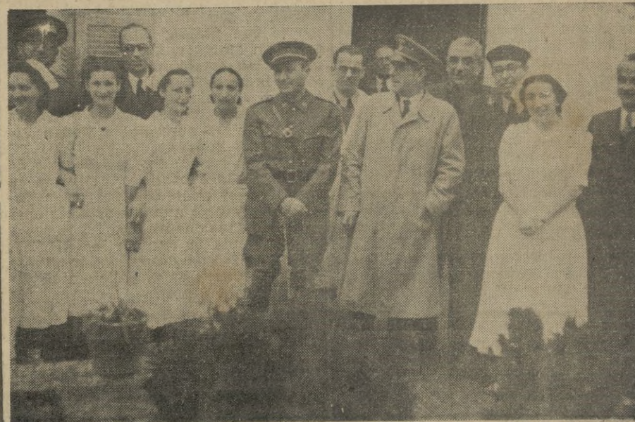
Después del acto este grupo de autoridades, jerarquías del Movimiento, director del centro y enfermeras afectas al mismo, posan ante el repórter gráfico Cuadrado.