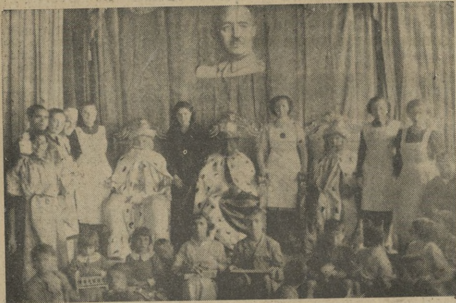
Luego Melchor, Gaspar y Baltasar acuden al Hogar de la Falange.