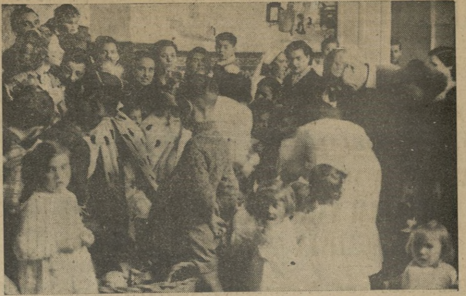
... para más tarde, en la Guardería Infantil, ser objeto de la admiración de estos pequeñuelos que les rodean.