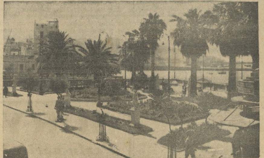
CEUTA. -- El jardín de San Sebastián magnífico mirador del Estrecho