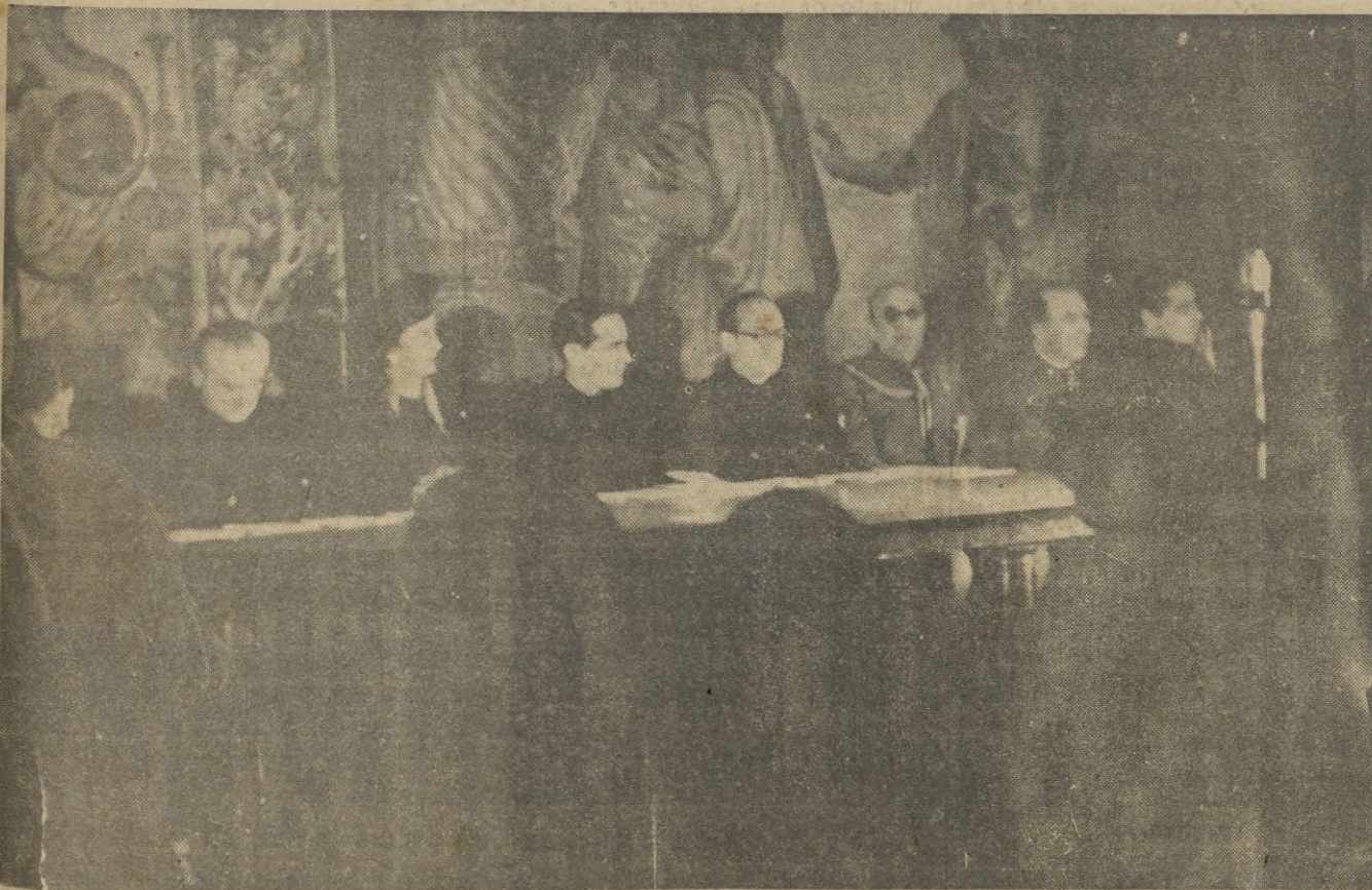
PRESIDENCIA DEL CONGRESO CON ASISTENCIA DE LA EXCMA. SRA. DOÑA CARMEN POLO DE FRANCO