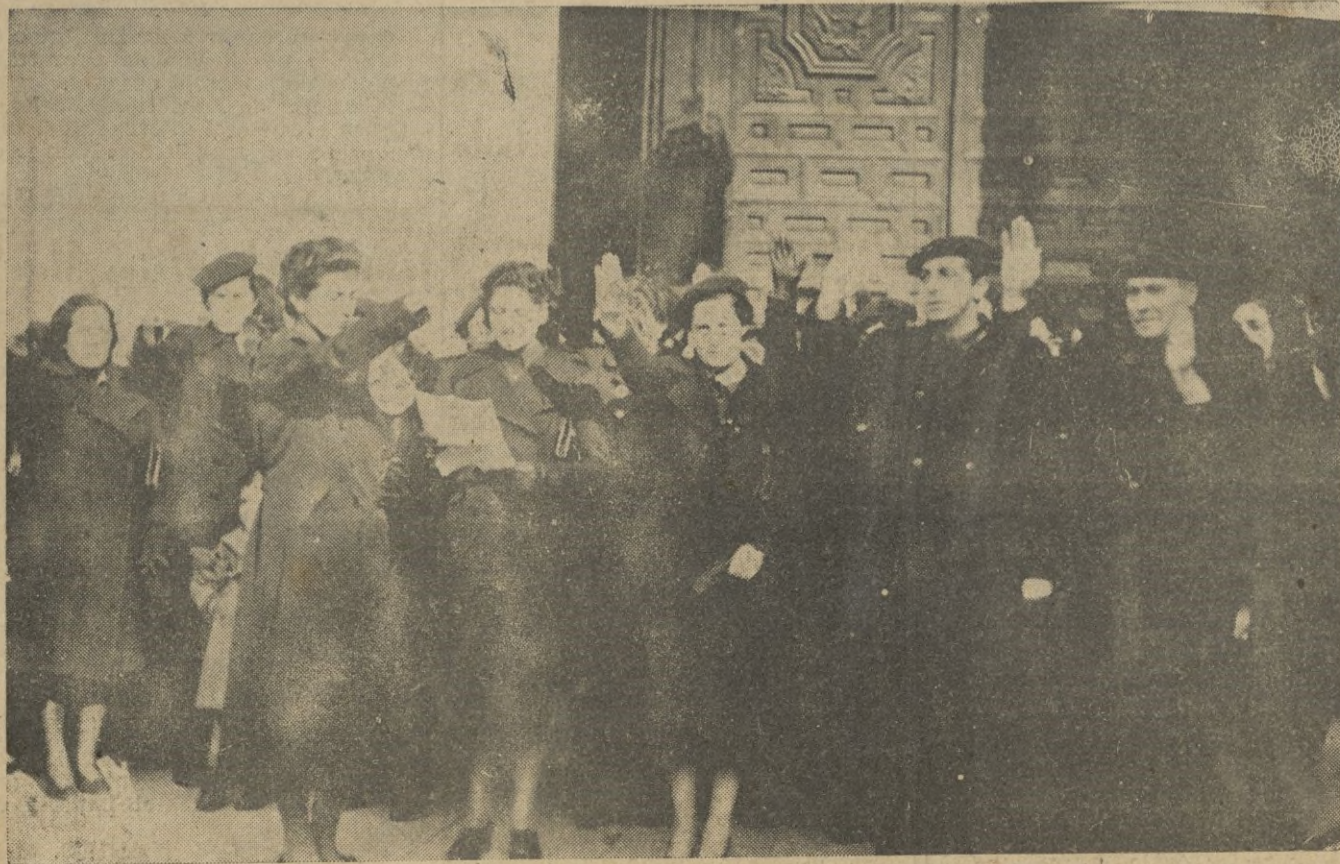
La Inspectora Nacional de la Sección Femenina, lee emocionada los nombres de los caídos por Dios y por España.