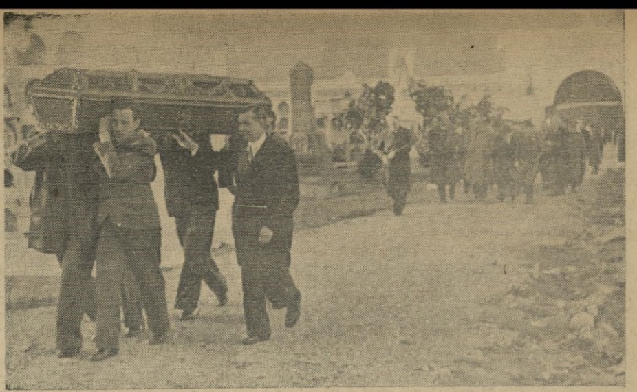
El cadáver, a hombros de amigos, es conducido a la Capilla del Cementerio.