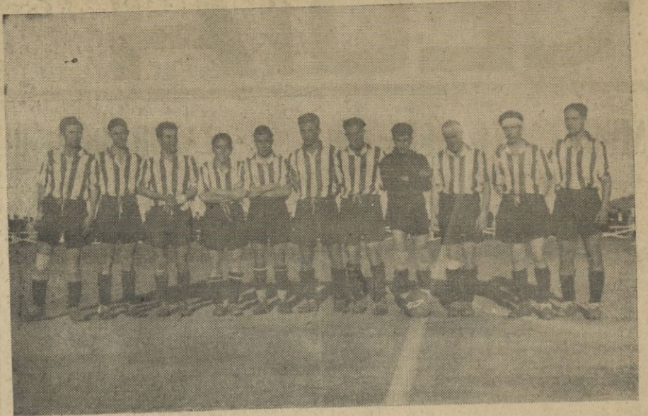
El equipo forastero.

Y nada más. Se ha perdido otro partido en casa y con ello se hace más difícil poder llegar hasta donde deseábamos y podíamos haber llegado. Pero esta vez no cabe culpar al equipo titular de este nuevo contratiempo y si únicamente a la Providencia, que tuvo por aliado a nuestro peligroso rival. Se ha jugado bien y se ha demostrado que hay equipo. Un equipo modesto acondicionado a nuestro reducido número de "aficionados", pero que ha dejado evidenciado sobre el terreno de