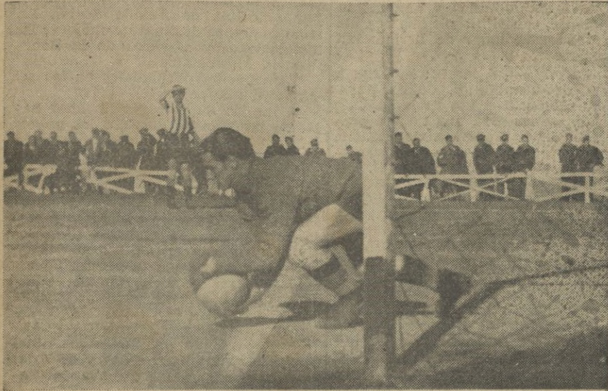
El guardameta del equipo merengue salva con maestría, un peligroso disparo

juego, tanta calidad y potencialidad como el que actualmente se encuentra considerado como el mejor del grupo y posee, además, una nómina de jugadores infinitamente superior. Así, dándole todo sobre el terreno de juego, tal y como hizo el pasado domingo el Ceuta-Sport, se justificaba el perder partidos. Se ha puesto todo en la lucha; se ha derrochado ardor y codicia; se ha demostrado buen juego... ¡y se ha perdido! ¡Cosas del fútbol! Casos como este ocurren casi a diario. No siempre gana el mejor, sino quien tiene la suerte a su lado. Y esta vez, desgraciadamente, la suerte ha sido la aliada de nuestro adversario para hacer imposible el mejor de los triunfos del equipo ceutista. Paciencia y... ¡no desmayar!