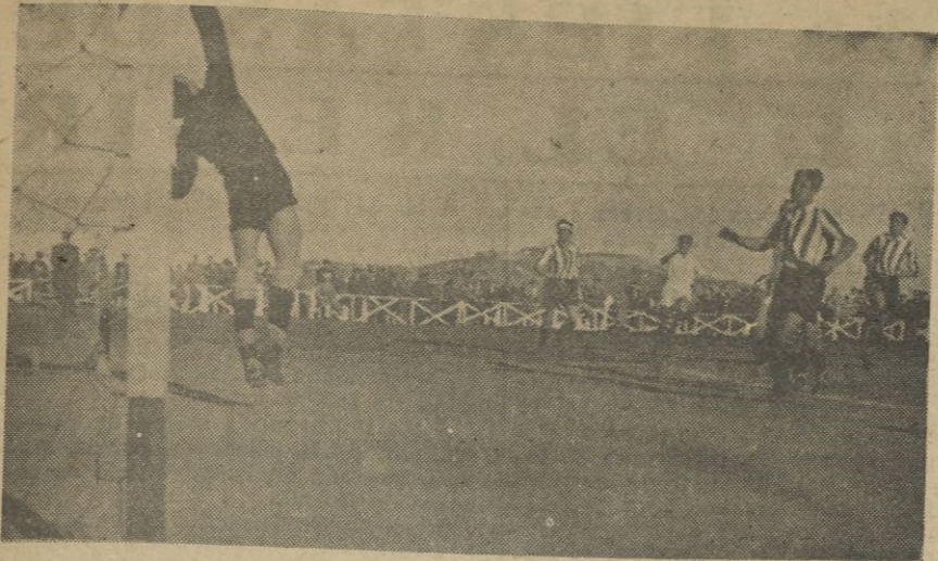
Floro, con una estirada inverosímil de ctiene un formidable tiro de Abad.