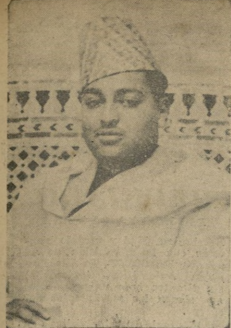
S. A. I. el Jalifa, Muley Hassan Ben el Mehdi, que el pasado domingo fué obsequiado por S. E. el Alto Comisario.