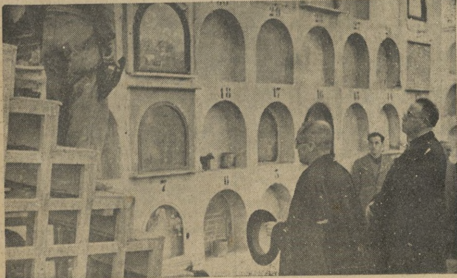
El M. I. Vicario capitular e ilustre Canónigo de la S. I. C. dedican una oración para encomendar su alma a Dios.