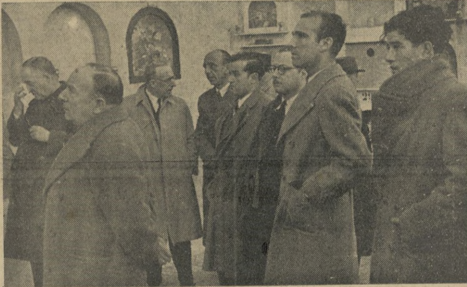
Los asistentes al acto, escuchan respetuosamente, el responso rezado por el Capellán de Santa Catalina.