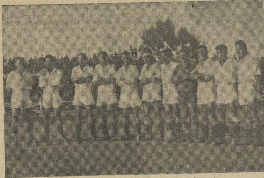
El Ceuta-Sport, tal como se alineó el pasado domingo.