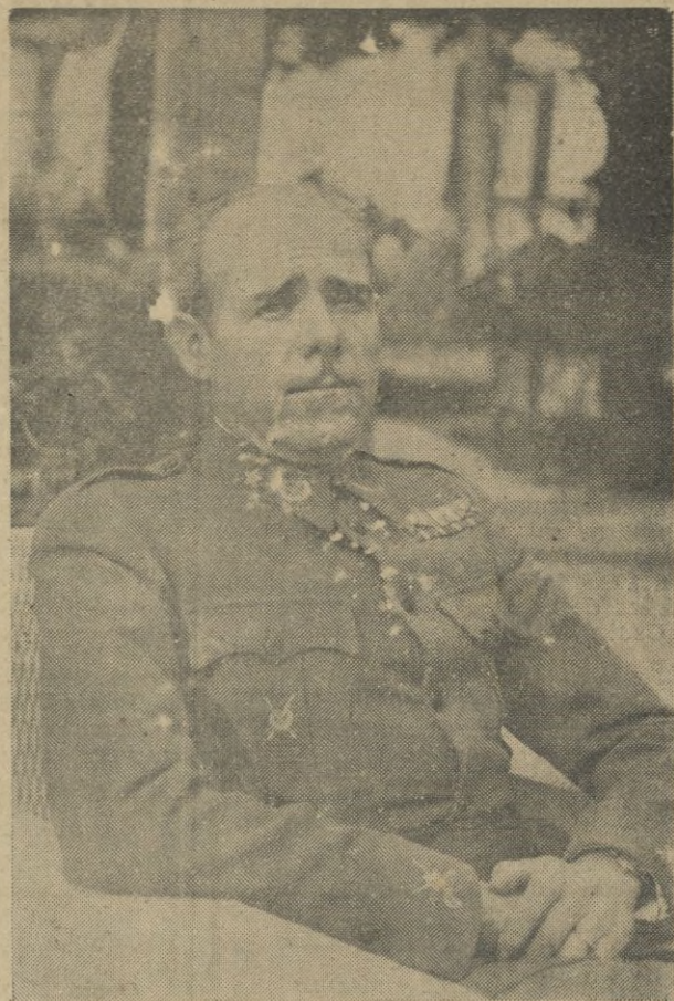
S. E. el Alto Comisario, General Asensio, que en la mañana del domingo ofreció un almuerzo íntimo a S. A. I. el Jalifa.