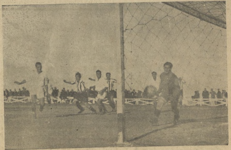
Reduelez, en salto prodigioso, detiene un tiro mal intencionado