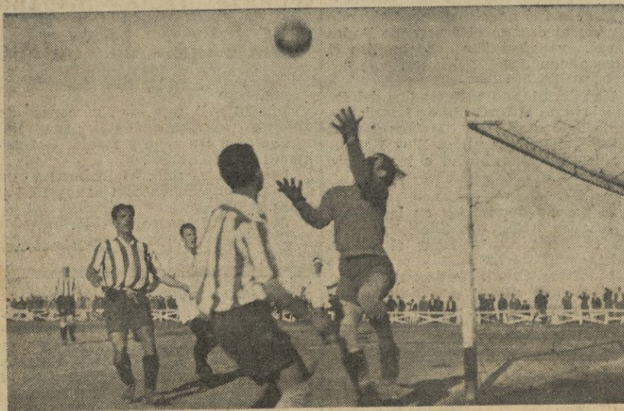
El cancerbero ceutí, contempla admirado, como se "cuela" el esférico en sus dominios.