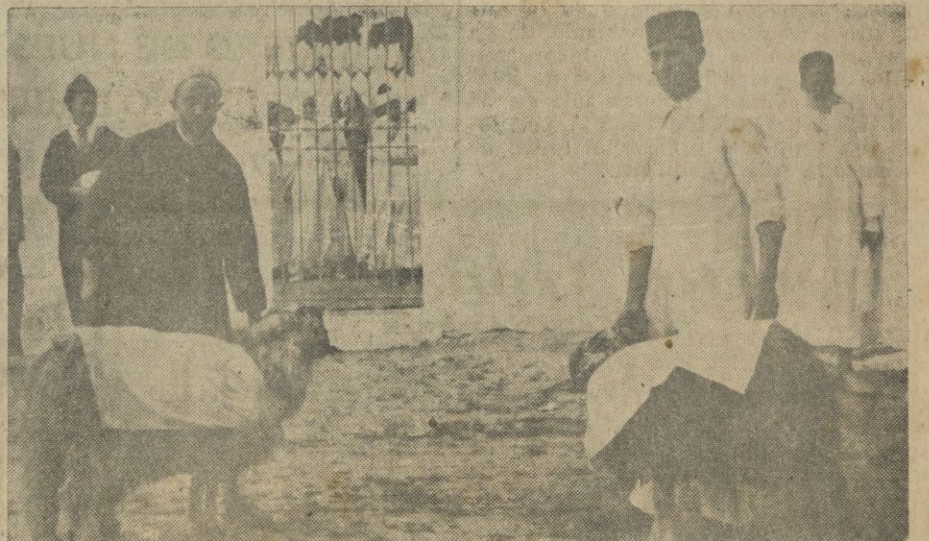
En el interior del templo esperan el sacrificio, lleno de simbolismo y de tradiciones koránicas, los carneros que han de ser degollados por el augusto Príncipe y su Gran Visir.