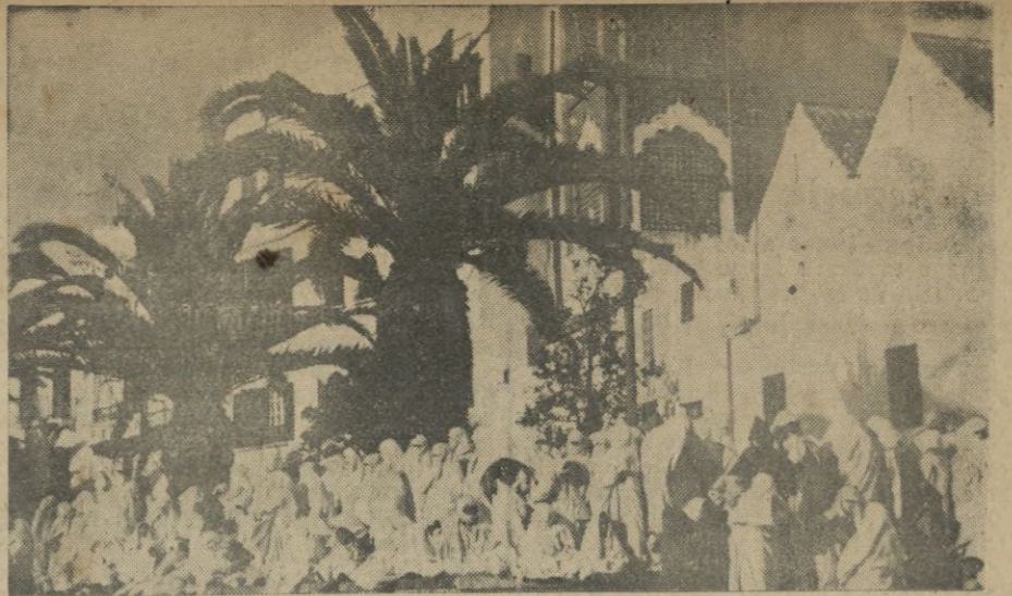
La multitud congregada en la plaza de España espera la salida de S. A. I. el Jalifa.