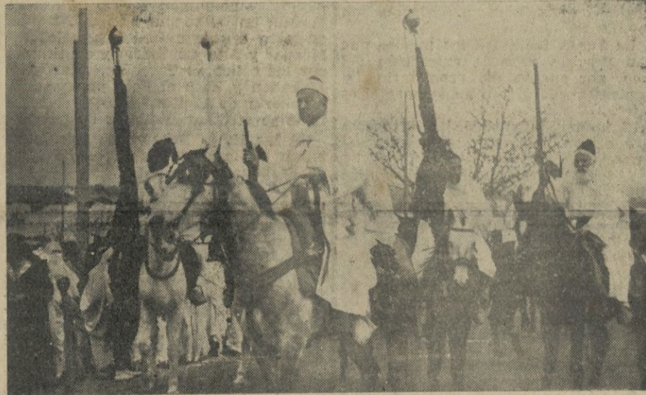
Se inicia la vistosa comitiva y al frente de ella, va el Bajá de la ciudad, Sid Mohamed Achaaax, seguido de los alcaldes de barrio

En la Mezquita de la Mesal-la, siguiendo el ceremonial de costumbre, se