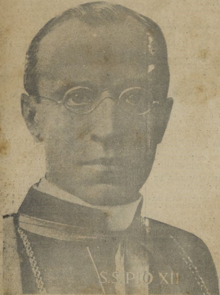
S. S. PIO XII

Este mensaje, es contestación del Santo Padre, al que Roosevelt le envió en Navidad. — (Radio Nacional).