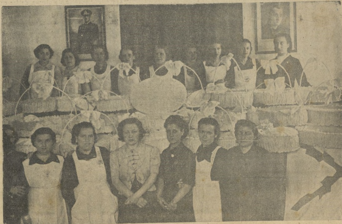
AUXILIO SOCIAL. -- Canastillas y las camaradas que las han confeccionado.

Cuando nos hallábamos a punto de (Pasa a la página siete.)