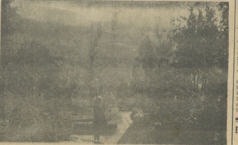
Uno de los más bellos rincones, de los que tanto se prodigan, en el gran par- que de la histórica Alcazaba de XAUEN