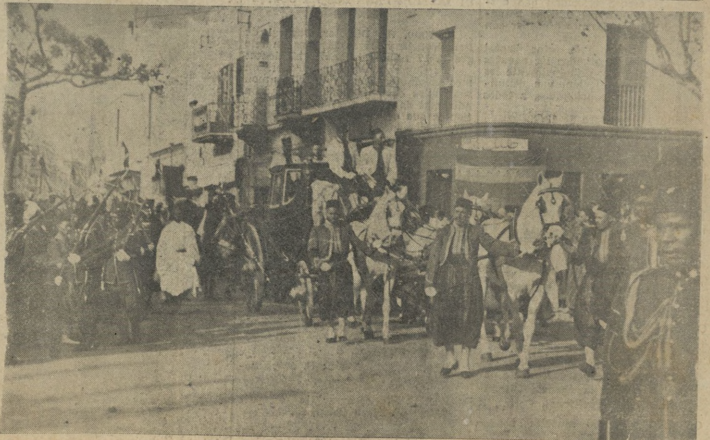
LAS FIESTAS DE AID EL KEBIR EN TETUAN. -- Por las calles del ensanche pasa la comitiva, Carroza en la que S. A. I. el Jalifa se trasladó a sa la Mesala. (Amplia información en la página 8).

El comunicado del Consejo declara (Pasa a la quinta página.)