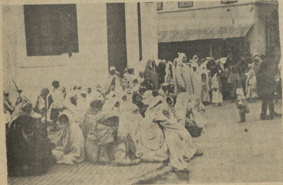
Grupo de familias musulmanas necesitadas esperando el turno para el reparto de bolsas de comidas y el borrego.

La exposición, por la calidad y cantidad de valiosos lienzos, promete constituir un verdadero acontecimiento.