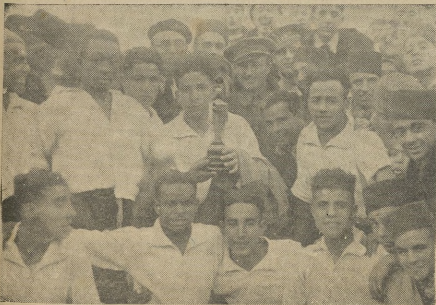
DEL BOXEO. -- Un directo.