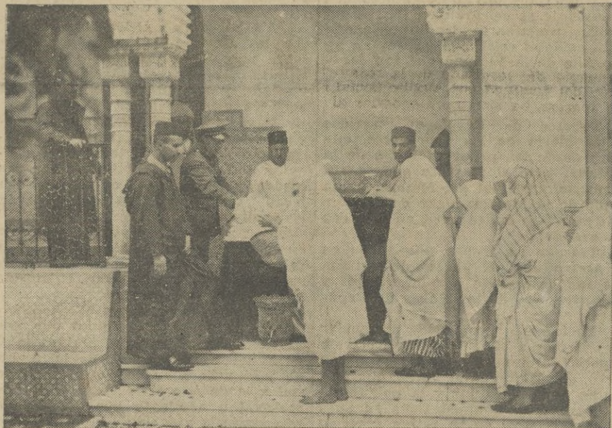
Entrega de ropas a familias necesitadas musulmanas

Ayer, lunes, a las once de la mañana, en el Bajalato, encontrándose presentes todas las autoridades locales y con ellas el señor Bajá de la ciudad, se procedió al anunciado reparto de prendas a los musulmanes pobres. Hasta la tarde duró esta distribución, constituyendo un espectáculo hondamente emotivo la presencia de las familias musulmanas, especialmente mu jeres, estacionadas horas y horas ante el Bajalato, sin temor a la lluvia, y