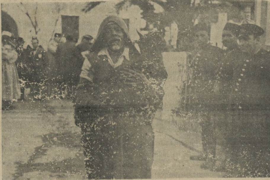
Un musulmán necesitado, lleva en brazos el borrego, y, en su semblante, la satisfacción del obsequio recibido.