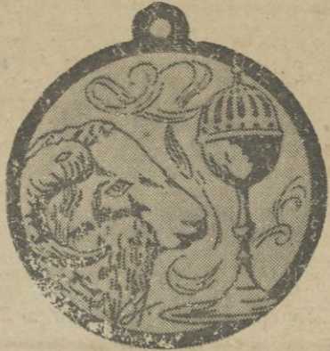
Simbólico emblema que fué colocado en la postulación de ayer

Por la mañana se celebraron sendos combates de boxeo, que sirvieron para congregarse en las alturas y alrededores de las Cuevas de Borbón una extraordinaria cantidad de público, entre el que abundaban los musulmanes.