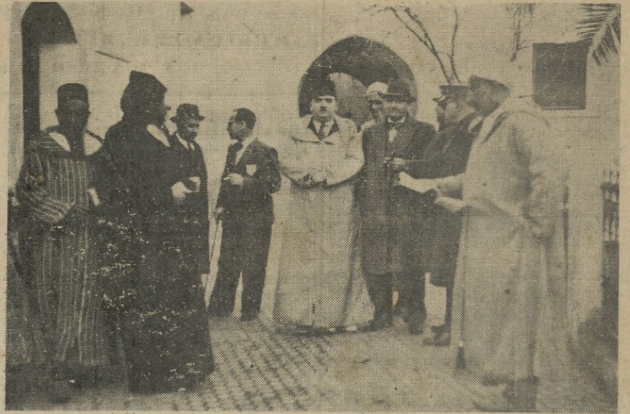
LA PASCUA DE AID EL KEBIR EN LARACHE. -- El Sr. Interventor Regional con el Bajá de la ciudad y otras autoridades presenciando el reparto de bo rregos.