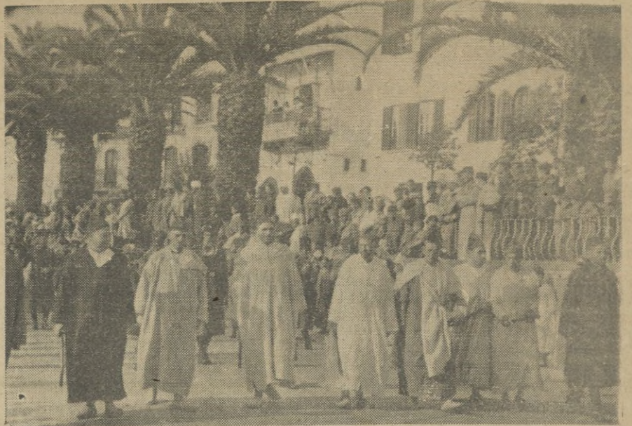
El desfile de las cofradías camino del Santuario para hacer la ofrenda al Patrón de la ciudad.

A pesar de ser un programa de fiestas oficiales, los boxeadores, sobradamente conocidos en nuestra ciudad y en las restantes del Protectorado, se mostraron extremadamente combati vos, dando lugar a varios combates in teresantísimos que prueban la enorme afición que reina en Tetuán por este deporte y la buena formación de los púgiles locales. Como seríamos muy extensos en detallar cada uno de los combates que se celebraron y además todavía se tiene que celebrar la revancha de los mismos, aplazada por el temporal reinante, dejamos para otro