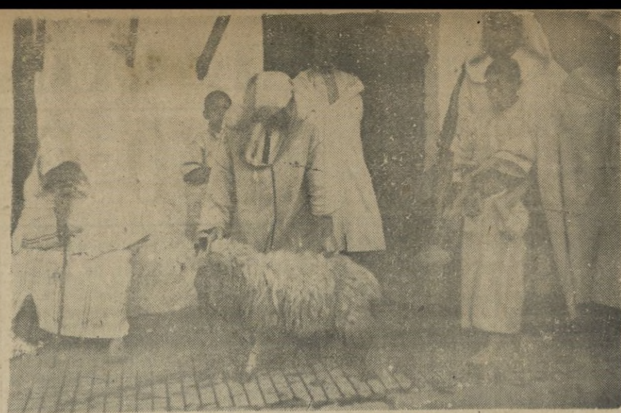
Un magnífico ejemplar de los borregos distribuidos entre las familias necesitadas del pueblo musulmán en Larache.

será proyectada la gran película "Romancero Marroquí".