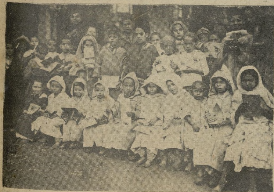
REPARTO DE JUGUETES EN TETUA N. -- Los pequeños posan antes nuestro objetivo después de recibir el juguete

Berlín, 22. -- El alto mando alemán dice en su comunicado oficial: "Sin acontecimiento destacables". -- (Radio Nacional).