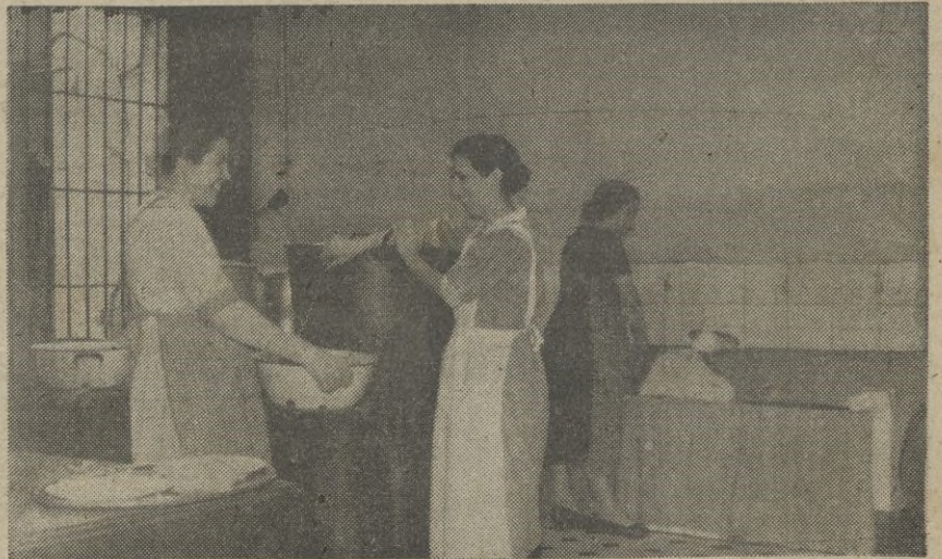
La cocina y person al en su servicio.