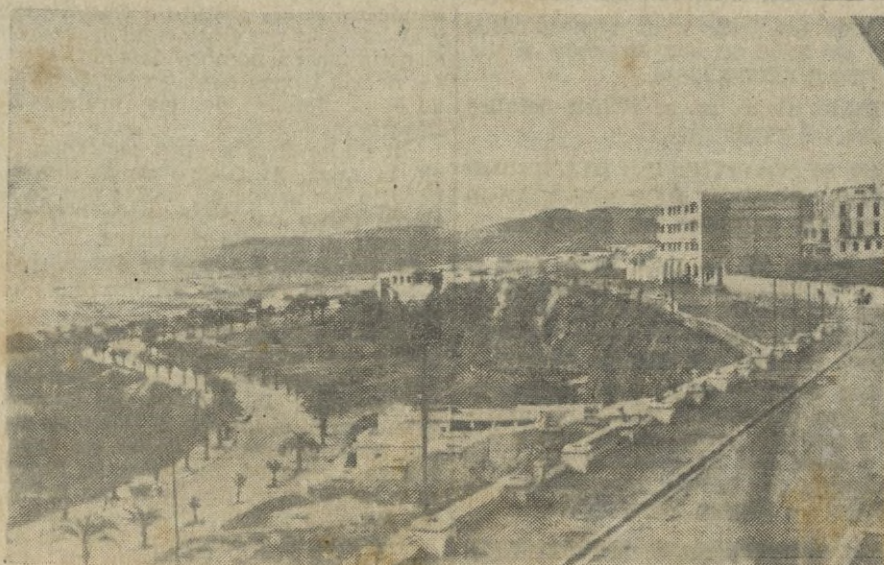
TETUAN. -- Una de las Avenidas más bonitas de la ciudad.

Es la tercera entrega que hace a tal fin y como homenaje al Glorioso Ejército Nacional, en el aniversario de la liberación de Barcelona.