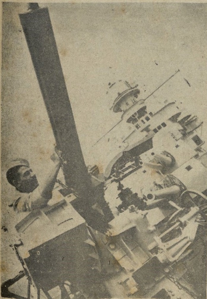
MARINA ITALIANA. -- Antiaéreo, de una de las potentes unidades de la armada fascista.

Varios periódicos extranjeros — dice — han reproducido unas supuestas declaraciones, aparecidas en un periódico de Copenhague. Creemos oportuno hacer constar que el contenido de tales declaraciones, atribuidas al Nuncio de S. S. en Dinamarca, no corresponden a la verdad. — (Radio Nacional).