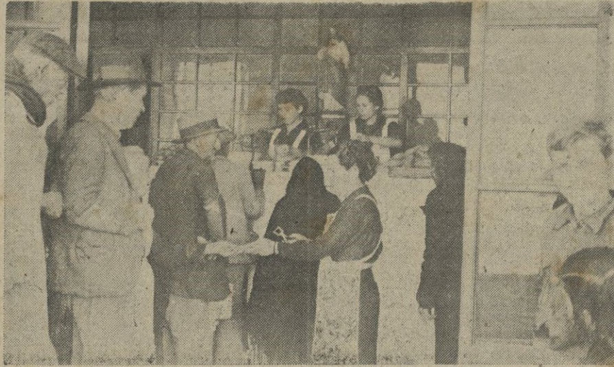
La Jefe de la Cocina, corta el ticket de la comida que va a ser servida.

En nuestra visita de ayer, hemos probado la comida que estaba sirviéndose y podemos asegurar que estaba perfectamente sazonada, y los ingre-