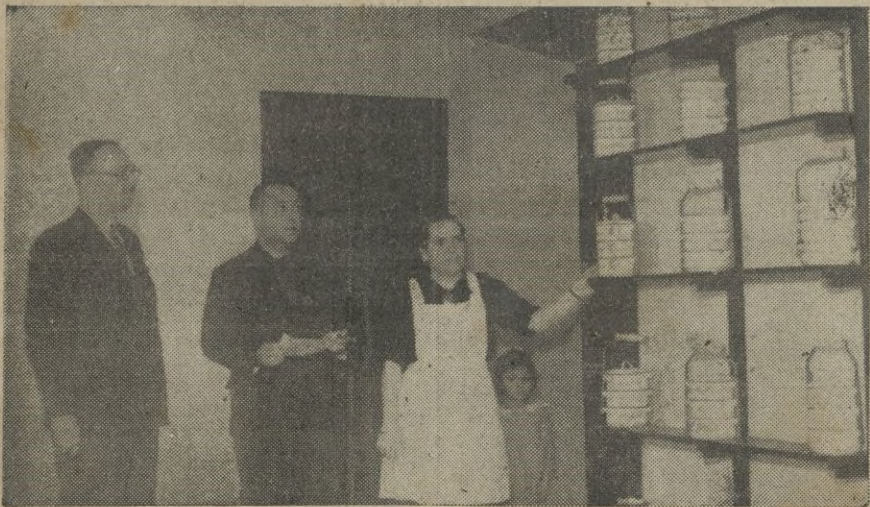
El Delegado Provincial de Auxilio Social y la Camarada Jefe, proporcionan a nuestro Redactor Político la información.

Siempre, sin una sola excepción, cuando consigue trabajar una semana o alguna vez más, hace un donativo para el Servicio, prueba patente de que es un español de corazón, que sabe agradecer el celoso cuidado que para su bien se organizó, al fundar la humanitaria obra de Auxilio Social.