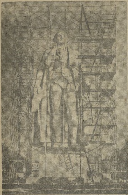
La estatua de Washington, en la Exposición de Nueva York, aparece protegida por una monumental jaula de hierro y tela para resguardarla de la intemperie, durante el invierno.