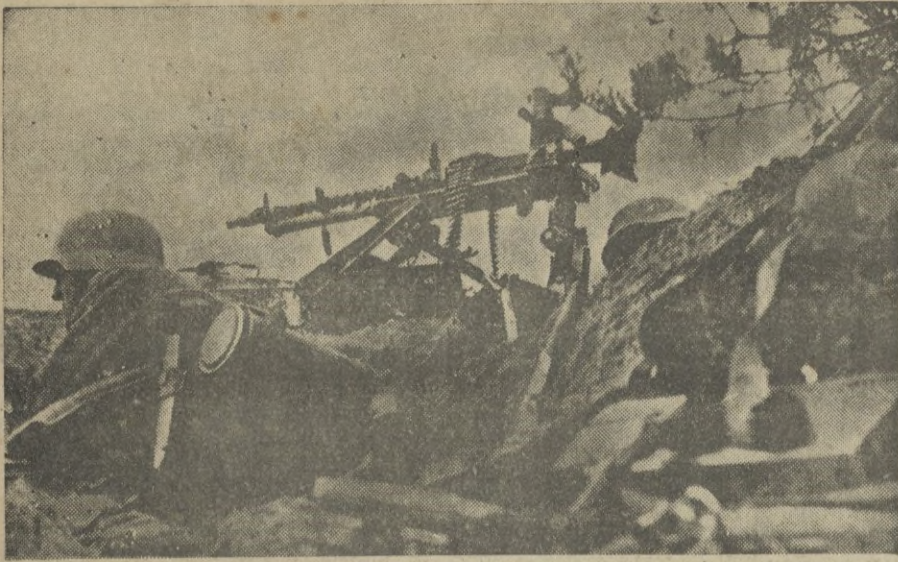
Mientras el soldado pegado a la tierra, vigila muy cerca de la máquina cualquier movimiento sospechoso...