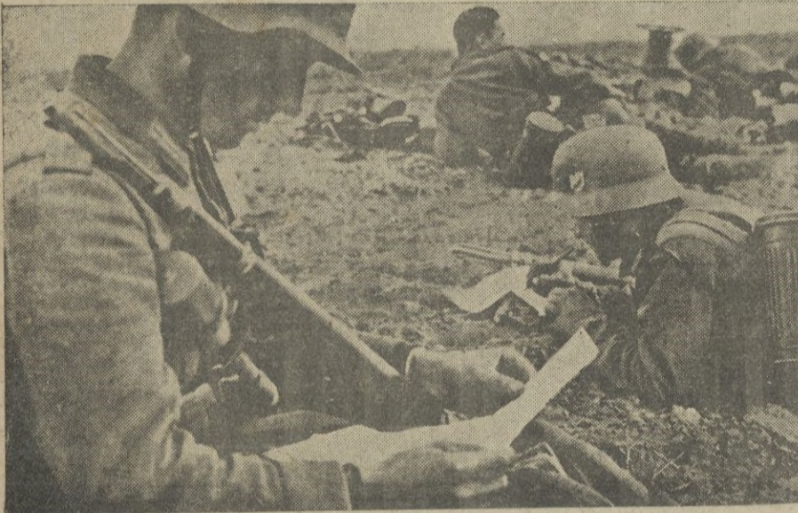
...otros compañeros aprovechan la calma del momento para llenar cuartillas en las que la emoción de los días gu erreros, se ve relegada por el "segui-mos sin novedad"