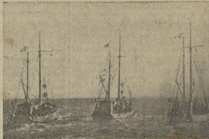
Minadores realizando su trabajo en el Mar del Norte.

Los cuatro jóvenes han sido enviados inmediatamente al frente y severamente castigados. — (Radio Nacional).