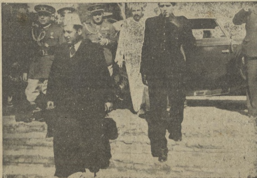
Momento en el que llegan a la plaza de toros de Los Viveros, S. A. I, el Jalifa y S. E. el Alto Comisario, acompañados de sus séquito. — (Amplia información en las páginas 4 y 5)