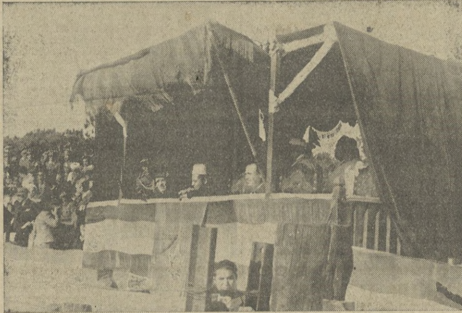
S. A. I. el Jalifa y SS. EE. el Alto Comisario y Secretario General, en la presidencia.

Antes de las tres de la tarde llegan a la Intervención Regional Su Alteza Imperial el Jalifa de la Zona, Muley Hassan Ben el Mehdi, con su Excelencia el Alto Comisario que viste uniforme de Jefe de Falange Española Tradicionalista y de las JONS,