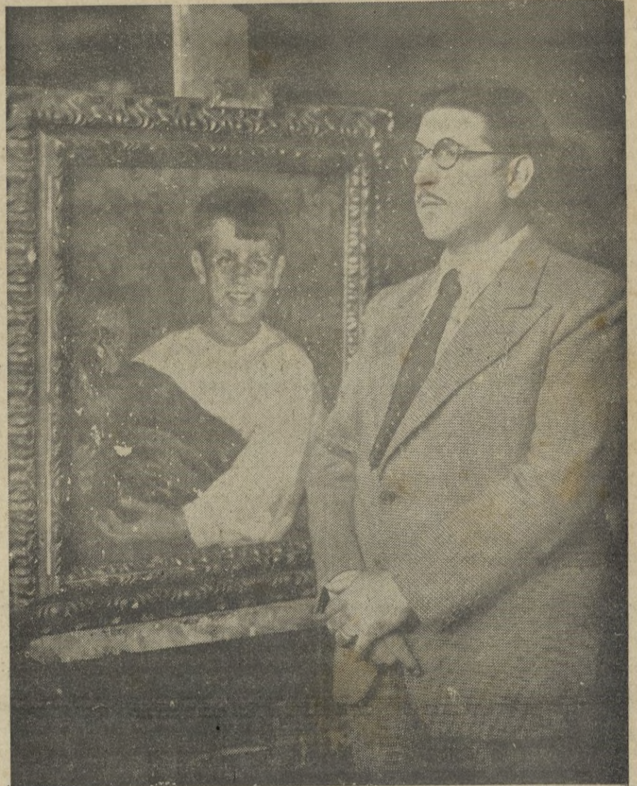
Conocido pintor costumbrista señor Cruz Herrera, cuya exposición en el Ministerio de Asuntos Exteriores ha sido clausurada

Madrid, 12. — En el ministerio de Asuntos Exteriores, ha tenido lugar la solemne clausura de la exposición Cruz-Herrera, que con tan singular éxito ha venido desarrollándose.