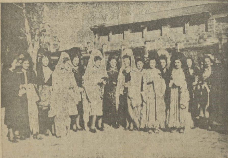
Bellísimas señoritas de Larache, Alcázar y Arcila, que actuaron de presidentas en el festival taurino.

Terminada la corrida el Príncipe Muley Hassan, con el Excmo. señor Alto Comisario, Excmo. señor Secreta-