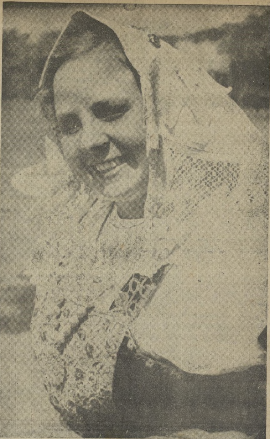
Una bella campesina italiana, vistiendo el típico traje de su país.

Berlín, 17.—La D. N. B. escribe que la decisión adoptada por el Almirantazgo británico, de armar a los buques mercantes, es considerada por el Reich como una violación de la Convención de Londres, sobre la guerra marítima. — STEFANI.