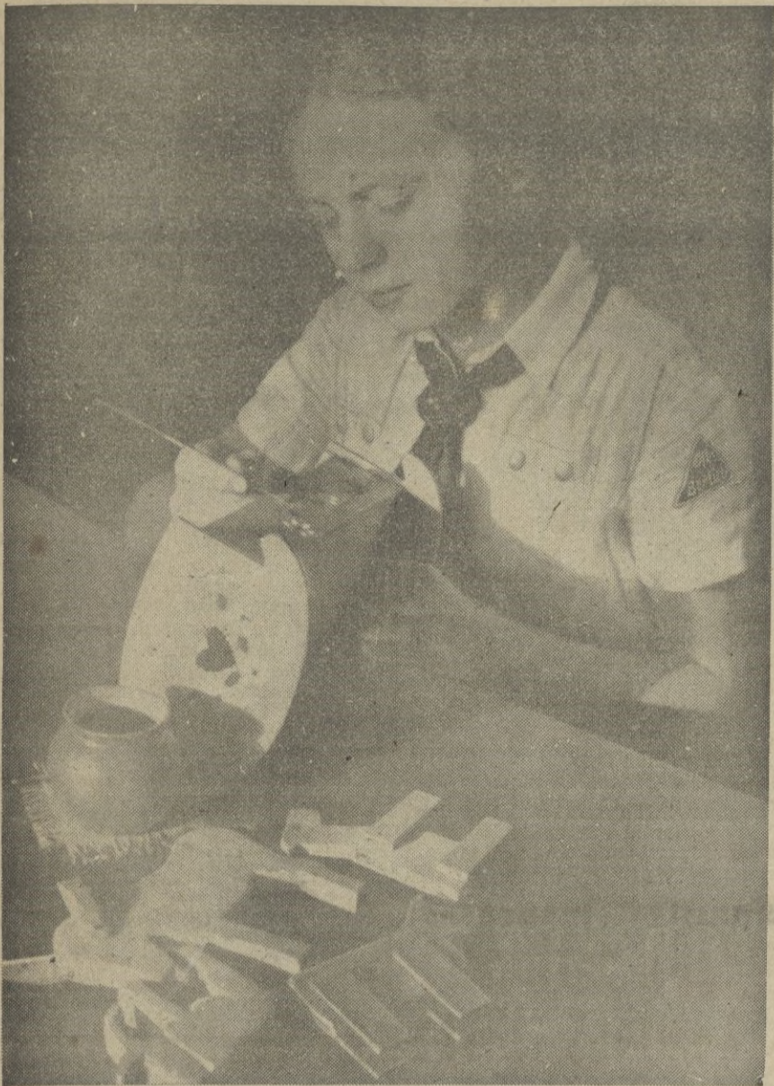
Esta bella obrera alemana, pone su alma de artista, al servicio de los niños, decorando finamente los juguetes que han de ser la delicia de éstos.