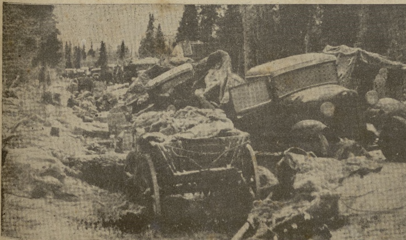
Vehículos abandonados por los rusos en la carretera de Pelkosenntemt.