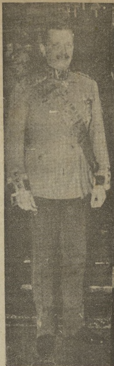
El Mariscal Mannerheim del que ayer dimos una amplia biografía.

Así es como le Gobierno francés se libra, de un huésped de demasado peligro para Francia. — STEFANI.