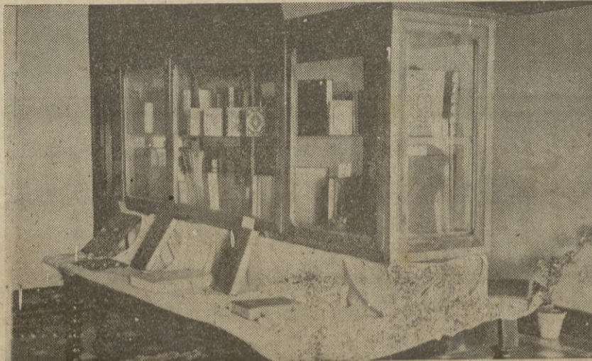
...junto a la vitrina donde se exhiben sus interesantes trabajos...

Es interesantísima la exposición. Su autora ha recibido infinidad de felicitaciones por estos trabajos y ha sido también un acierto que se den a conocer — creemos que por primera vez públicamente — en estos territorios donde la labor cultural en sus varias ramas, una de ellas ésta de investigación y constante recuerdo de siglos gloriosos, se sigue desarrollando.