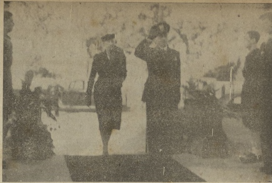
S. E. el Ministro de Italia, acompañado de su esposa, al entrar en la Iglesia para su inauguración.

Durante el primer alerta dado en la mañana, cuarenta aviones soviéticos han volado a gran altura al Oeste de la capital. — STEFANI.