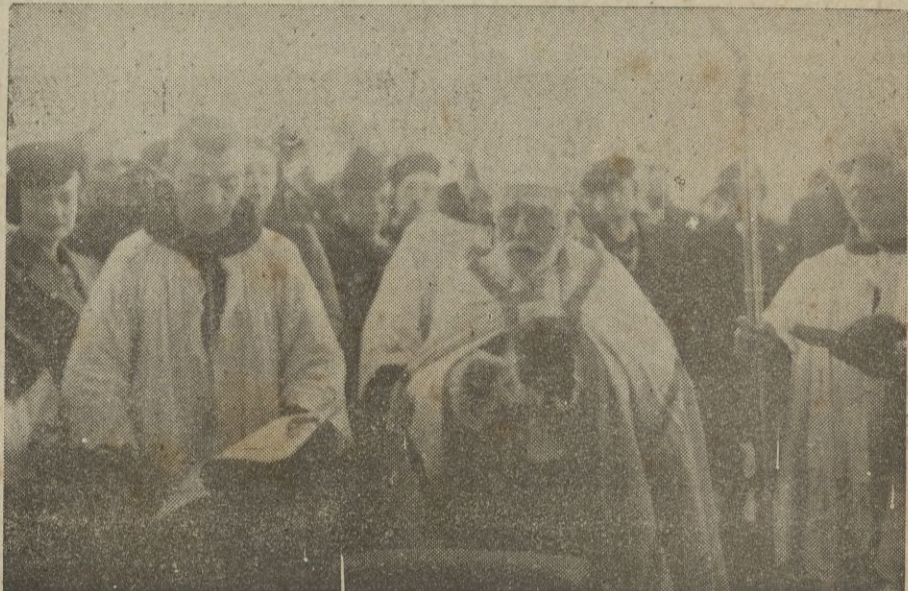
Acto de la bendición de la Iglesia.