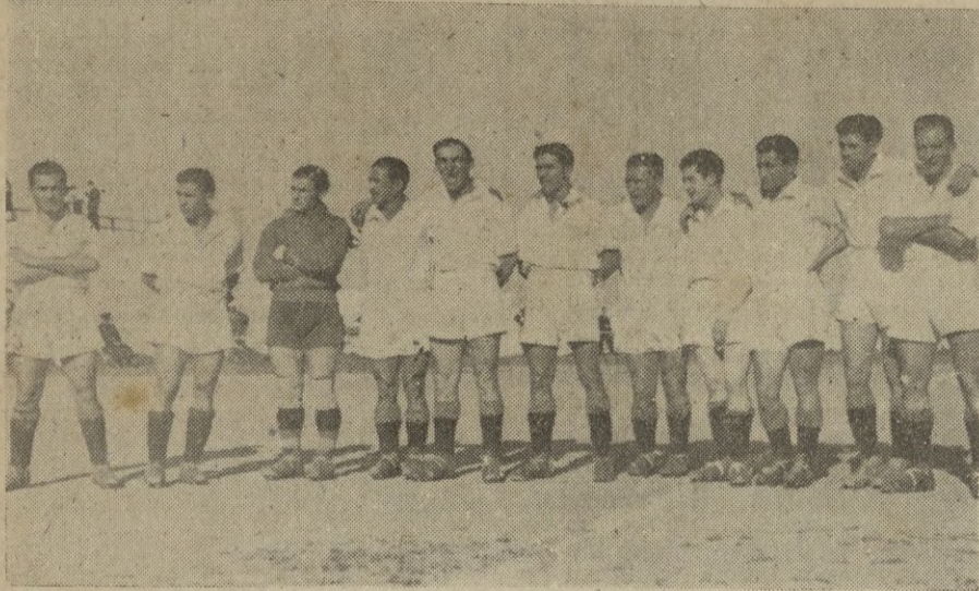
El equipo del Ceuta Sport en su alineación del último encuentro