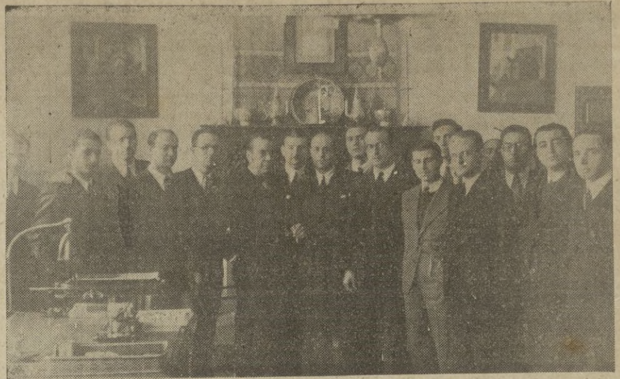
Los nuevos Ingenieros Industriales en su visita a Tetuán recorren la Escuela de Artes e Industrias Musulmanas, siendo recibidos y acompañados por su director señor Bertuchi y profesorado de la misma.