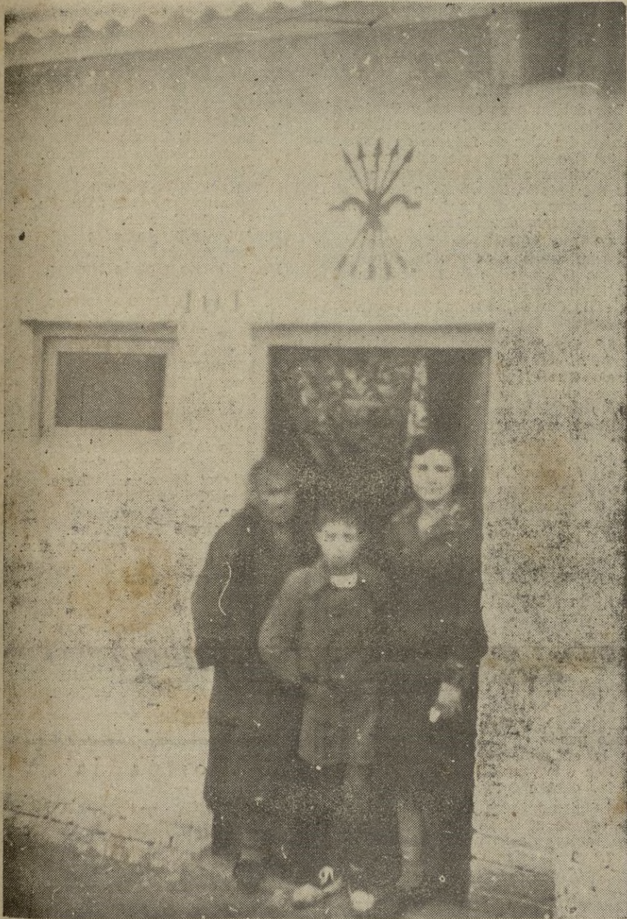
Madrid. — Con gran brillantez ha tenido lugar la inauguración oficial de la barriada de casas construida en Comillas.