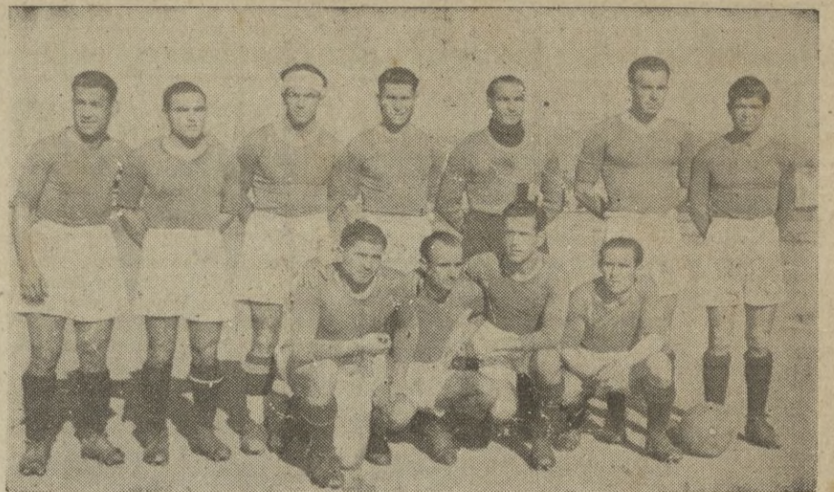
El Xerez F. C., ganador del encuentro del pasado domingo