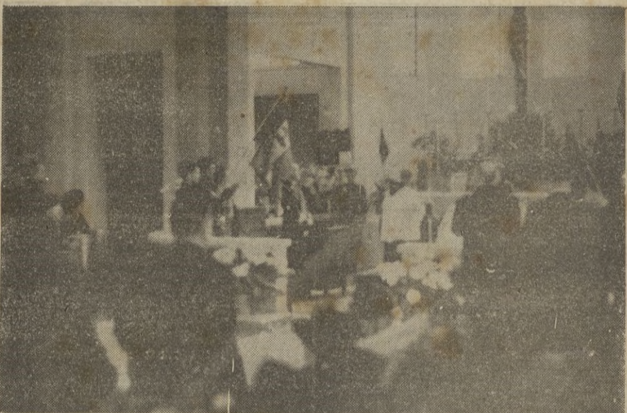
Autoridades, asistiendo a la primera misa, después de la bendición. (Véase información en la página 6)