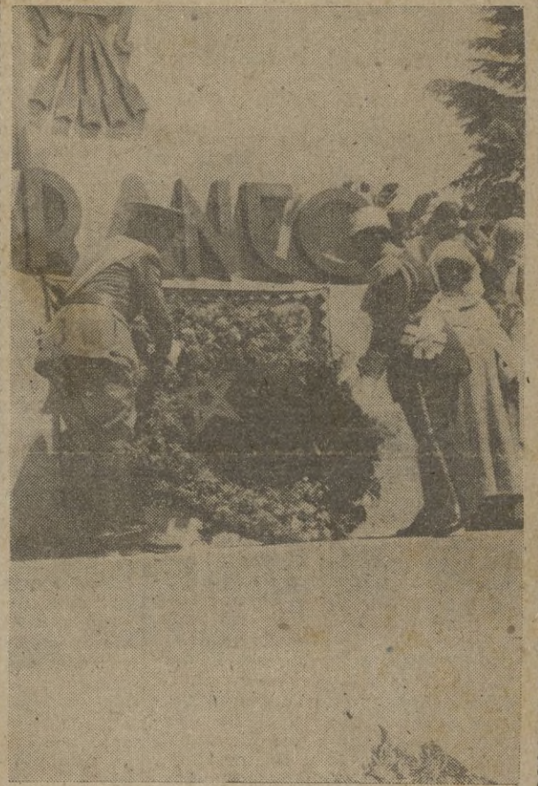
S. A. I. y el Excmo. Sr. Alto Comisario de España en Marruecos depositando una corona al pie del Monumento.

En día tan de luto para España, ¡hoy cuarto aniversario de su infame asesinato!, los buenos ceutíes dedican a su memoria una función piadosa que como funeral se celebrará en la Iglesia de la Virgen de Africa. El pueblo entero de Ceuta asistirá a él, para ofrecer al admirado maestro, testimonio ferviente de su profundo sentimiento, encomendando su alma a Dios.