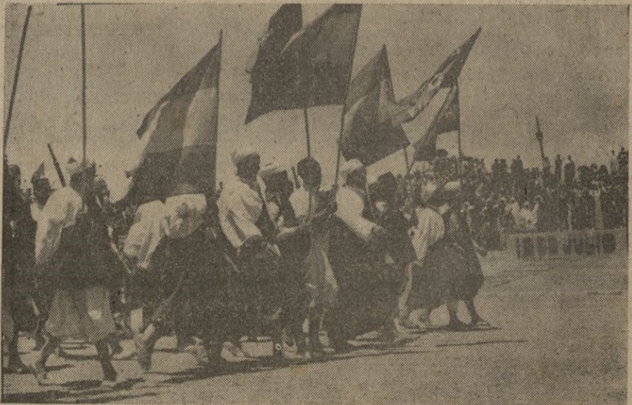
Una Mía de la Mehal-la del Rif de las que ayer desfilaron en el Llano Amarillo.