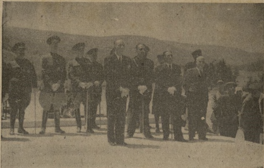
Los Excmos. Sres. Delegados Gubernativos y los Ilmos. Sres. Alcaldes de Melilla y Ceuta en el acto de inauguración del Monumento.