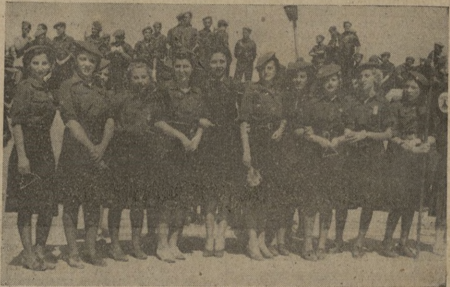
Camaradas femeninas de la Falange de Ceuta, en el acto de ayer