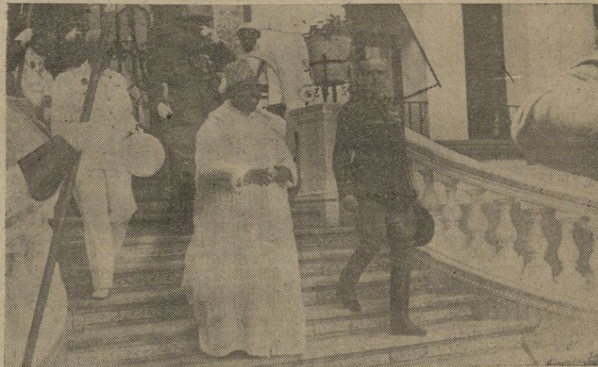
S. A. I. el Jalifa y el Alto Comisario de España en Marruecos al salir de la Residencia.