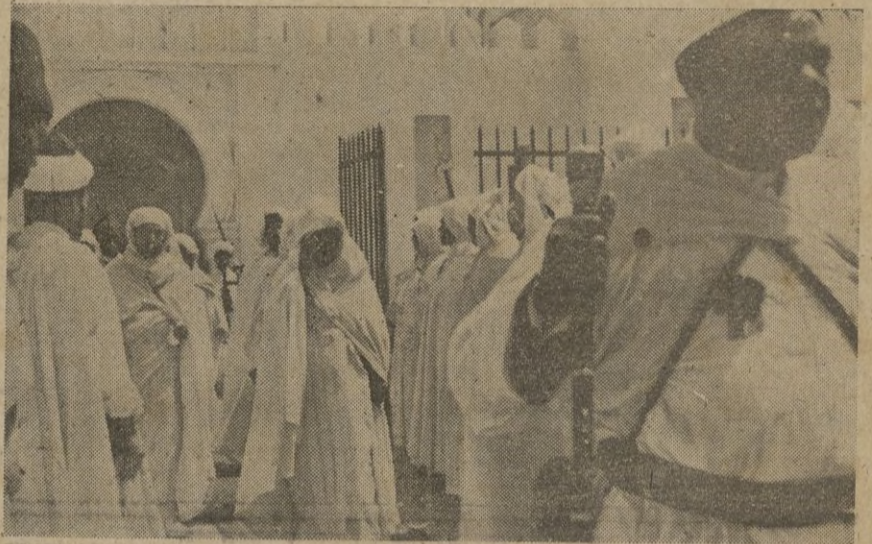
El Jalifa sale de la Mezquita después de sus rezos. En primer término el Chamberlán del Palacio Jalifiano.