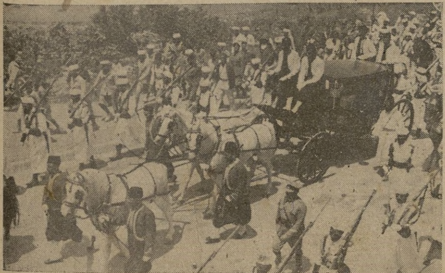
Carroza y caballos, que nuestro invicto Caudillo regaló a S. A. I. el Príncipe Muley Hassan y que ayer condujeron a éste hasta la Mezquita.

Seguidamente salieron acompañados por Von Ribbentrop de Bertsgaden y regresaron a Salzburgo. — EFE.