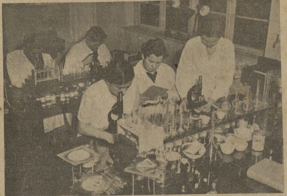
Escuela colonial alemana para mujeres. Prácticas en el laboratorio

Berlín, 29. — Cuartel General del Führer. — En el día del aniversario de la firma del tratado de Versalles, el Führer ha visitado la antigua ciudad Imperial de Estrasburgo. En la orilla alsaciana del Rin, el Comandante en Jefe del Ejército que logró quebrantar la línea Maginot, General de Artillería, Colmand, ha saludado al Führer.