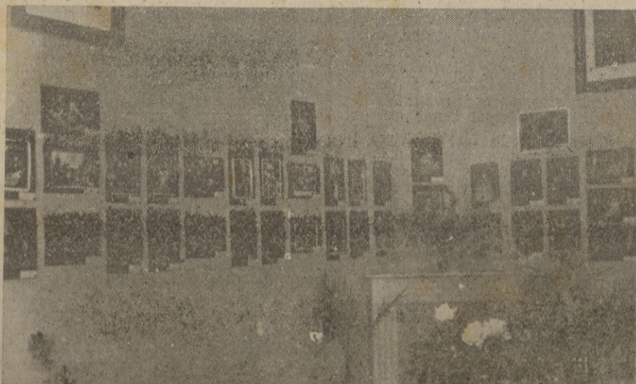
TETUAN. -- Exposición de reproducciones fotográficas de cuadros célebres

Diariamente regresan a la capital miles de evacuados, que se reintegran a sus hogares, después del armisticio. — EFE.