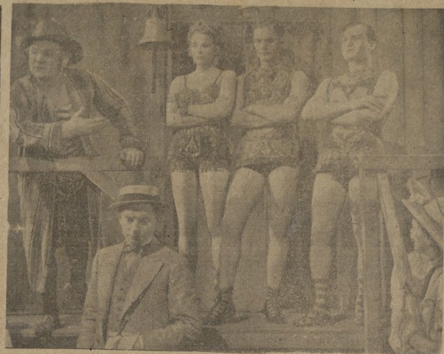
Los tres hermanos Codonas, trapeicistas formidables, que actualmente filman en la Tobis una superproducción.

Añade que en las primeras horas se registraron tres raids aéreos, en