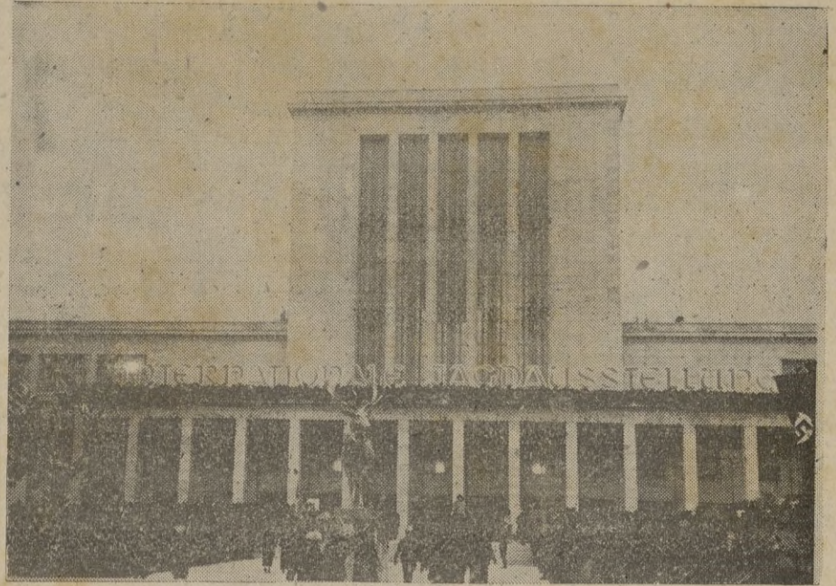
Exposición de Montería Internacional en Berlín

Estas iniciativas del general Hertzog en el campo parlamentario reflejan la agitación que se desarrolla cada vez con mayor violencia entre la población boer. Pero la amenaza que constituye la presencia en el país de imponentes fuerzas de aviación inglesa las cuales, a pretexto de tener que participar en la guerra contra Italia en el Africa Oriental, ejercen violenta presión sobre las masas rurales boers y la concentración en la base naval sudafricana de Simonstown de importantes fuerzas navales inglesas las cuales han desembarcado numerosos destacamentos de infantería de marina que han sido distribuidos en los principales centros para el mantenimiento del orden público, son elementos que contribuyen a llevar hasta el paroxismo la tensión ya existente entre boers e ingleses. Desde ayer, en todas las principales ciudades de la Unión Sudafricana se están celebrando grandes reuniones de protesta contra la acción anticonstitucional del gobierno por las calles con la bandera bierno Smuts. Los manifestantes desfilan cantando himnos sudafricanos, La agitación, especialmente en el Transvaal adquiere carácter de verdadera revuelta. — STEFANI.