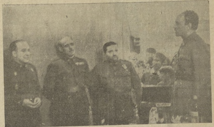
El comandante militar de la plaza y Presidente del Casino Español ofreciendo el acto en nombre de este centro. Al fondo el público tetuaní que estacionado en la calle ante la insuficiencia del Casino, presencié el acto a través de los ventanales.

za a hablar el heroico homenajeado. Comenzó diciendo que la emoción apenas si le deja proferir palabra alguna. Da las gracias y dirigiéndose a SS. EE. los generales presentes, a todos los demás Jefes y oficiales y a los elementos civiles español y musulmán presentes, les expresa su reconocimiento por la atención que han tenido asistiendo; se refiere al Casino Español, este Casino, —dice que considere como prolongación de mis hogares, el cuartel y mi casa, pues se han librado verdaderas batallas para desterrar del mismo y de su Junta directiva a aquellos elementos masónicos y marxistas que antes del Movimiento querían hacer de este centro feudo para sus maquinaciones. (Aplausos).