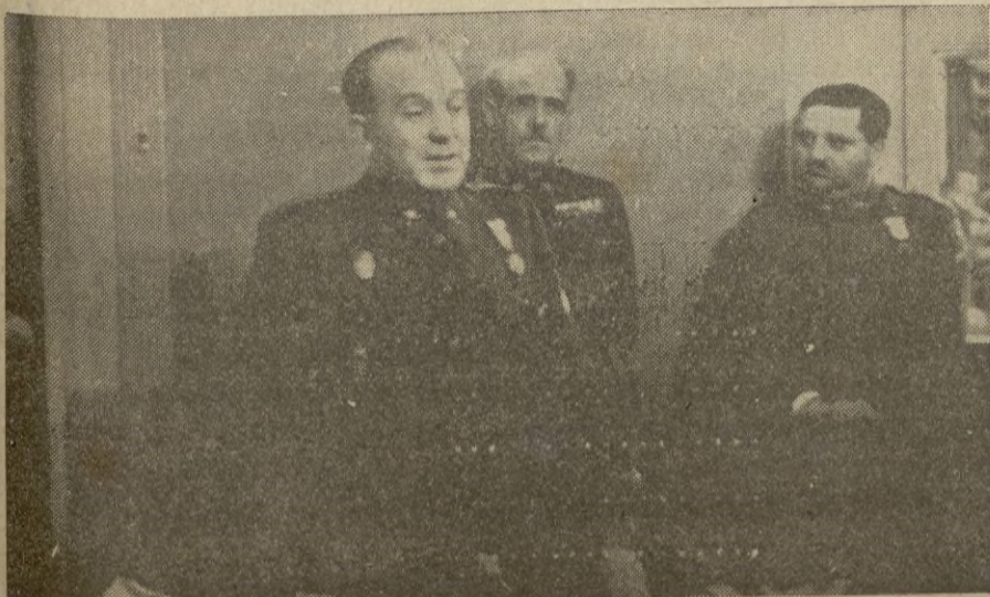
El General Buruaga en su magnífico discurso de agradecimiento. Junto a él los Generales Asensio y Bautista Sánchez