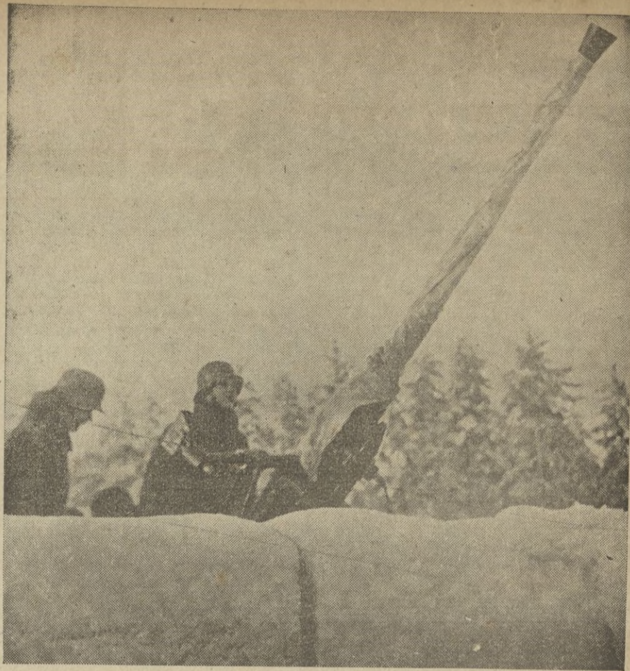
Antiaéreo finlandés en su trinchera de hielo.