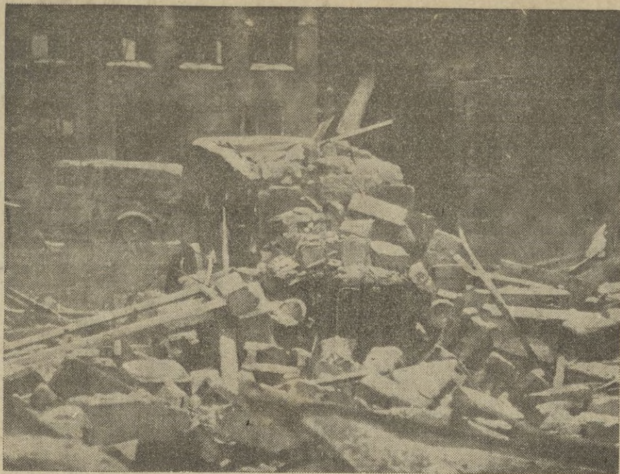
Efectos horrorosos de una bomba de aviación en la capital de Finlandia

Asistieron distinguidas personalidades de la Embajada y colonia española, de los Ministerios de Negocios Ex