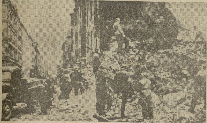
Cuadrillas de salvadores, fineses, buscan las víctimas de los bombardeos entre los escombros

América va a conceder a Finlandia un préstamo de veinte millones de dólares