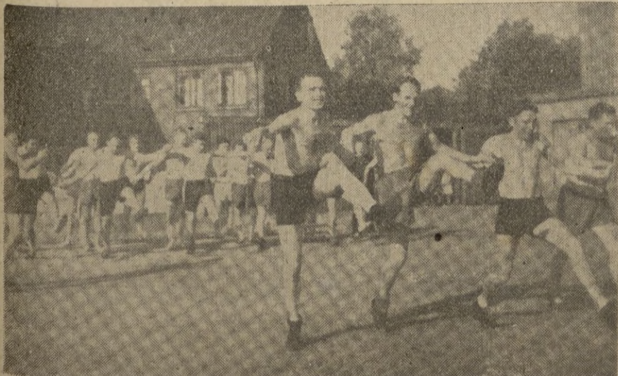
Otra demostración deportiva de los jóvenes alemanes.

El Embajador italiano en el Vaticano y el Nuncio Apostólico darán con este motivo recepciones, a las que asistirán las personalidades más destacadas de la Sociedad romana.— STEFANI.