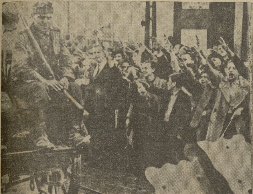
Las legiones alemanas motorizadas, son despedidas por la muchedumbre, brazo en alto y mano abierta, cuando marchan al frente.

Mientras en Estocolmo continúan las negociaciones para la paz, los finlandeses se mantienen en Viborg