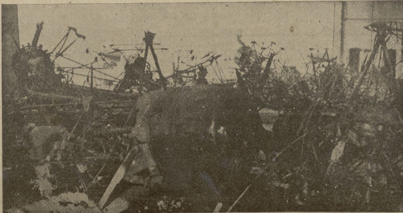
Restos in formes de lo que fué material ruso e ostosísimo.