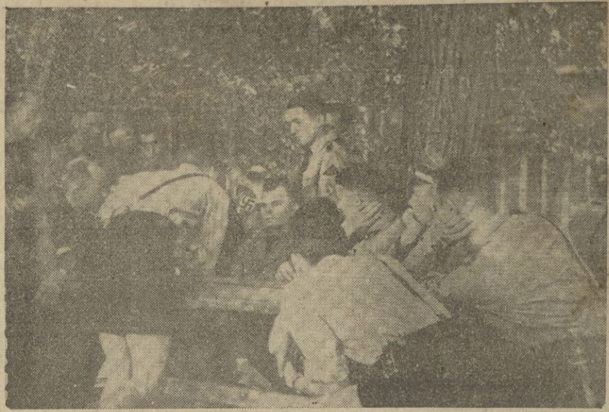
Las juventudes hitlerianas, cultivan los deportes y filman algunos documentales de sus ejercicios al aire libre.

Londres, 9. — En el mitin organizado por una Sociedad inglesa en pro de la paz Lord Ronsombg pronunció un discurso diciendo que si los beligerantes no aceptan la invitación de Roosevelt para llegar a una paz por mediación de los EE. UU., Roosevelt deberá convocar a una conferencia de países neutrales, para que formulen condiciones que los beligerantes se verían obligados a aceptar. — STEFANI.