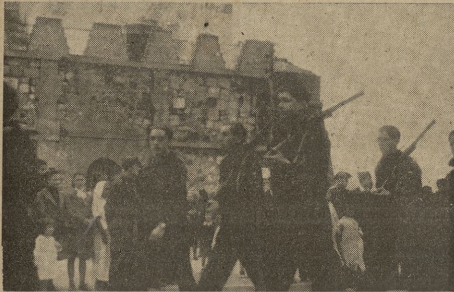
Los Cadetes desfilan marcialmente ante el Santo Cristo ya de nuevo en su hornacina.