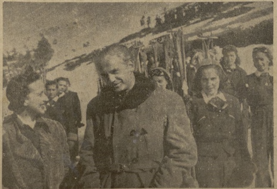
LOS CURSILLOS DE SKI DE LA SECCION FEMENINA DE F. E. T. Y DE LAS J. O. N. S. - Madrid. - El Excmo. Sr. Serrano Suárez y su señora, con las camaradas que hicieron los Cursos en el Puerto de Navacerrada.

Londres, 11. — Después de haber (Pasa a la cuarta página.)