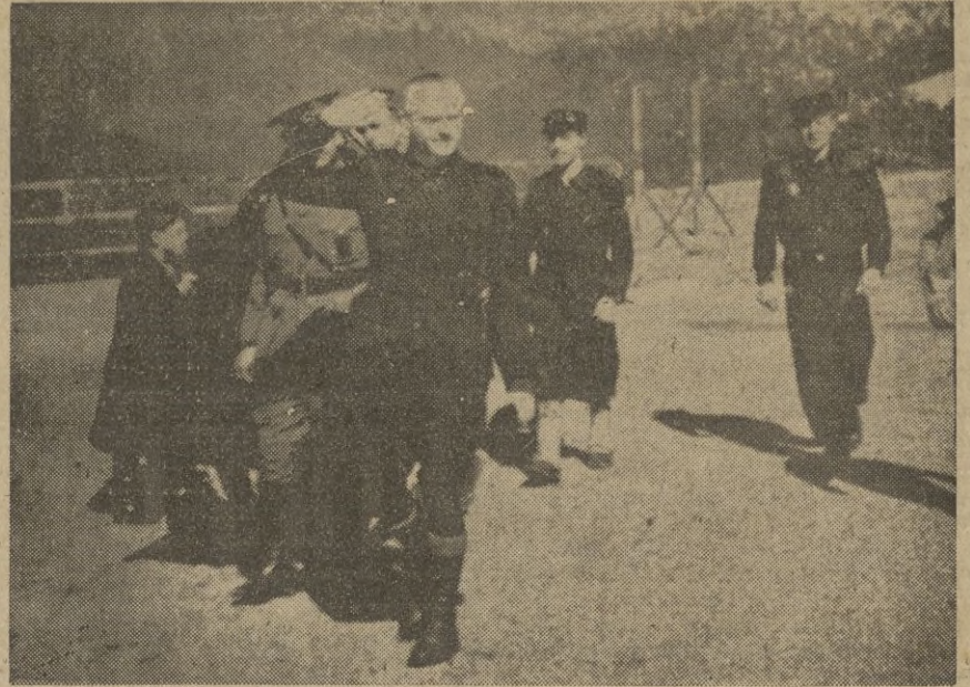
Madrid. - En el puerto de Navacerrada, el Presidente de la Junta Política y Ministro de la Gobernación, Excelentísimo Sr. D. Ramón Serrano Súñer, pasa revista a los flechas montañeses.