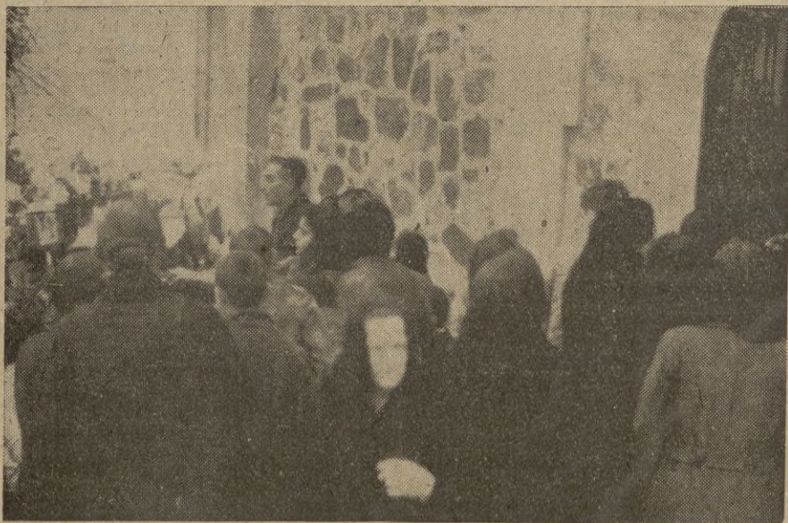
La multitud devota se acerca a Jesús Crucificado para ofrecerle sus oraciones fervorosas