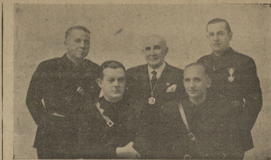
La comisión del Ayuntamiento, que ayer regresó a nuestra ciudad, después de cumplir el mandato de la Gestora

El mismo ministro, contestando a otra interpelación, declaró que el Gobierno ha creído el momento actual el más oportuno para proponer a la