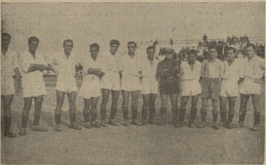
EL Ceuta Sport