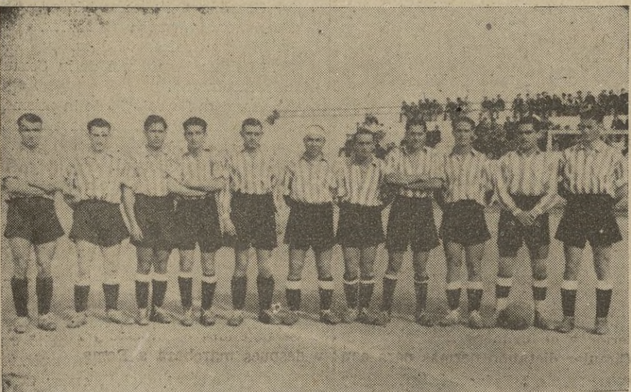
Equipo del Athletic Club Tetuaní