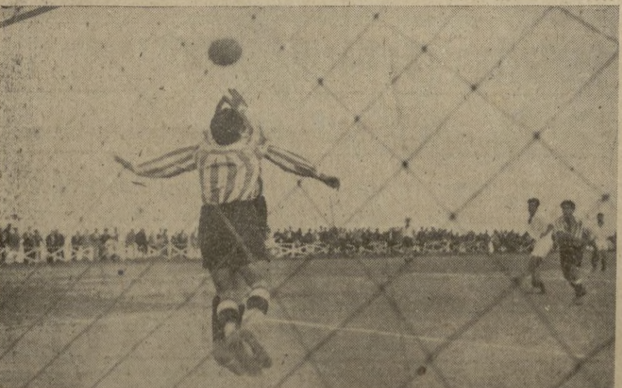
Portero y defensa del Athletic en una desesperada intentona, logran detener un chutazo bien dirigido.