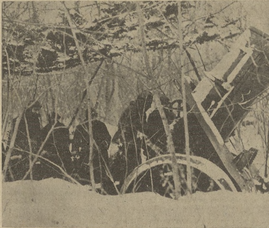
Pieza del 120 corto, camuflada, en las trincheras francesas, dispuesta para entrar en acción.

SUPPLICAN, asistan a las misas, por el eterno descanso de su alma, que tendrán lugar, hoy 27, desde las siete de la mañana, en la Iglesia de San Francisco.