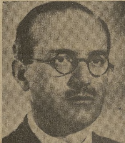
De Educación Sr. Ibáñez Martín