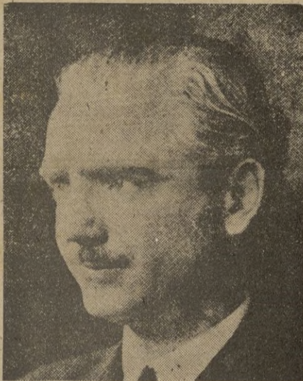
De la Gobernación Sr. Serrano Súñer