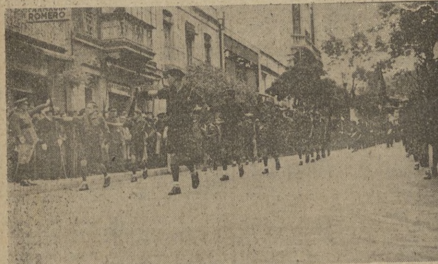
Cadetes y flechas desfilan marciales ante las autoridades civiles y militares