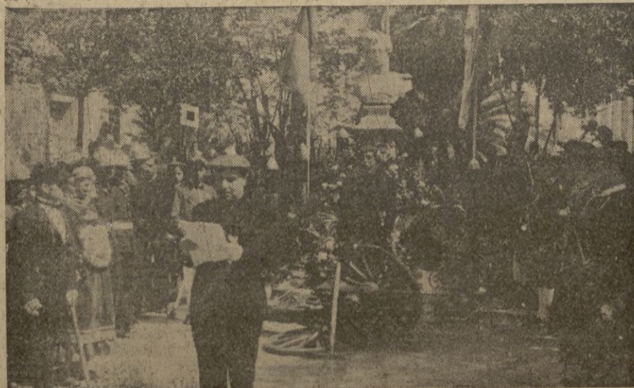
El Delegado de OO. JJ. camarada Vi llacañas, lee su importante alocución, alusiva al acto.