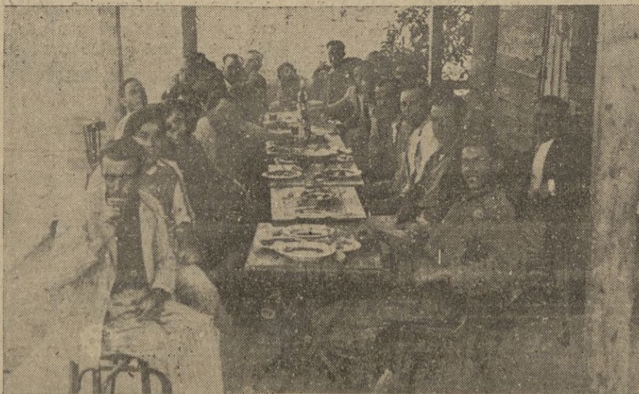
Simpático aspecto de la mesa en que con agradable camaradería, alternan obreros y dirigentes de la construcción de la Iglesia