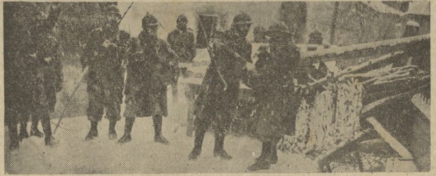
Servicios telefónicos en las avanzadas.