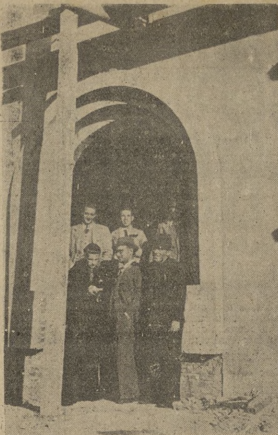
Los técnicos y cofrades, a la puerta de la Iglesia de la Almadraba explican a nuestro colaborador, cómo ha podido ser construido el templo, en su aspecto económico

Durante la misma, reinó una verdadera confraternidad y camaradería entre todos los allí reunidos.