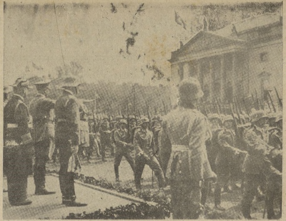
Gran desfile del Ejército alemán.

La Paz, 7. — El Gobierno ha levantado el estado de sitio. — EFE.