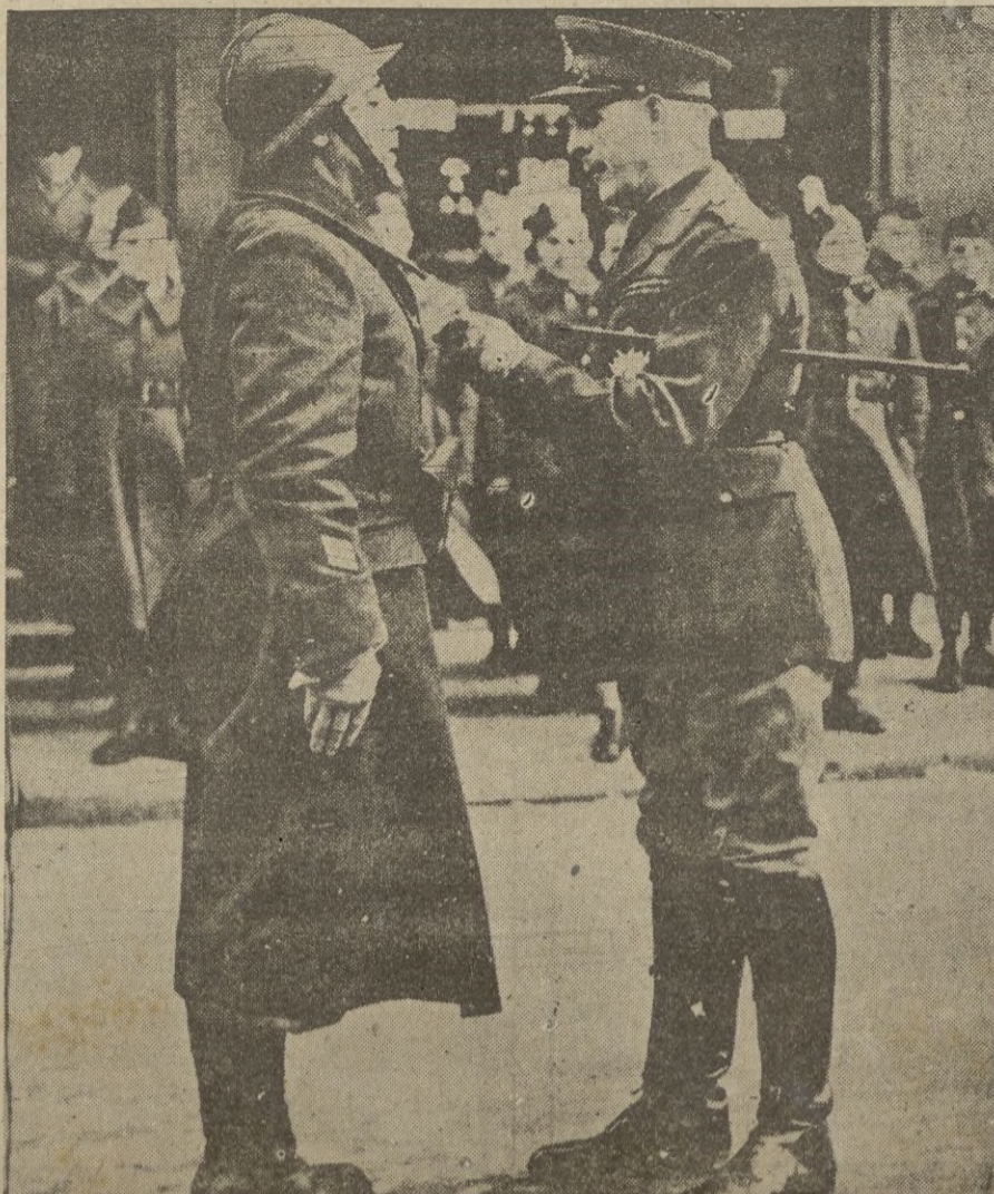
Lord Gort, comandante en jefe de las fuerzas británicas condecora a un sargento mayor francés.

Únicamente los militares profesionales noruegos, serán mantenidos presos hasta que el Gobierno noruego desista de hacer la guerra al alemán o hasta que estos soldados den su palabra de honor de no empuñar las armas para hacer la guerra contra Alemania”. — EFE.