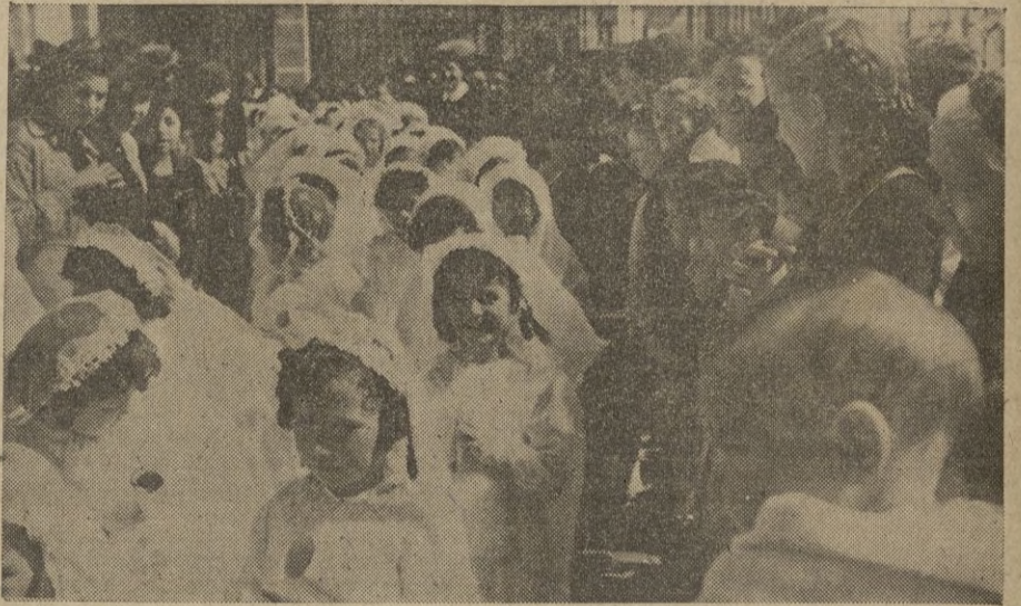
Las pequeñas salen del templo de después de terminada la Santa Misa