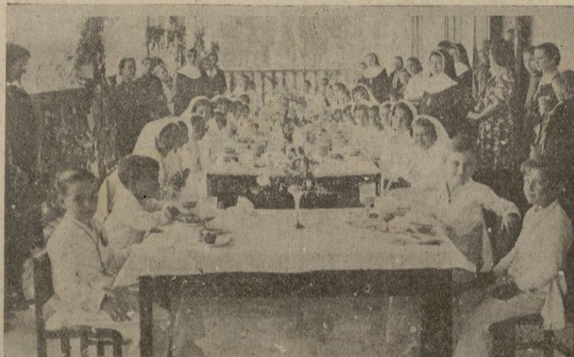
A las niñas, les es servido un magnífico desayuno en el comedor del colegio