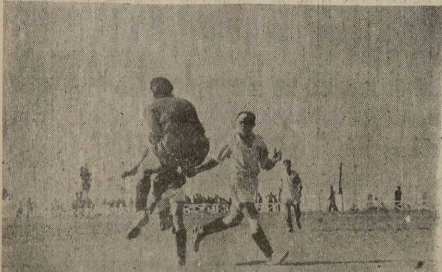
A pesar del resultado del partido también el Villa Nador pasa sus apuros, como lo demuestra esta parada que hubo de realizar su portero.