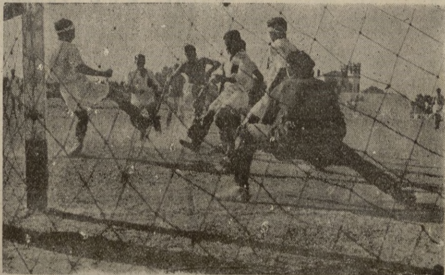
Un momento difícil para la meta melillense.