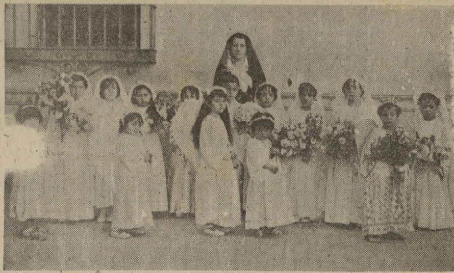
Grupo de niñas que hicieron el pasado domingo su primera comunión, y religiosas que dirigen los estudios en dicho centro de enseñanza.