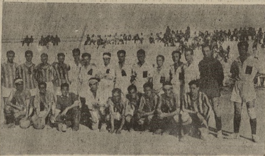
Los equipos Villa Nador de Melilla y Deportivo Ceuti local, cuyo encuentro se verificó el pasado domingo de segunda categoría eliminatoria, para el ascenso a primera.