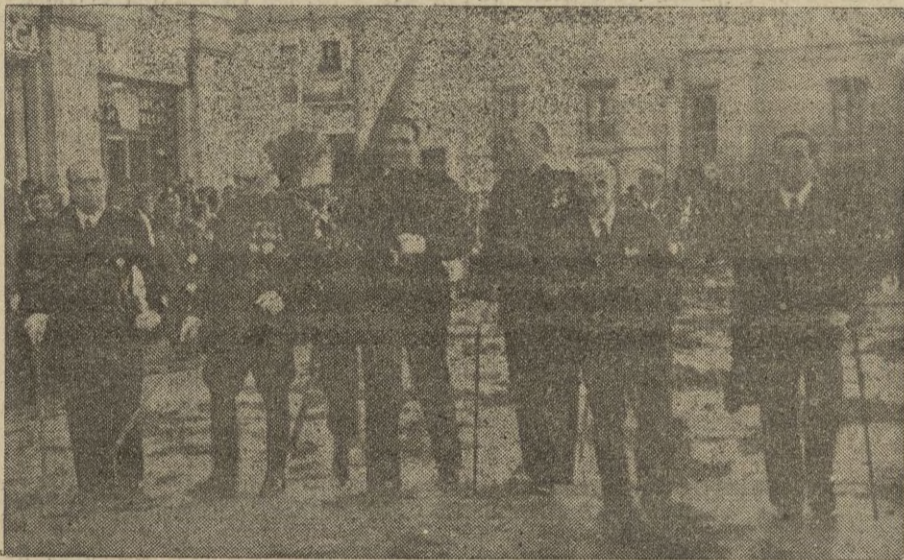
Presidencia de la procesión en la que figura el Pendón de la ciudad