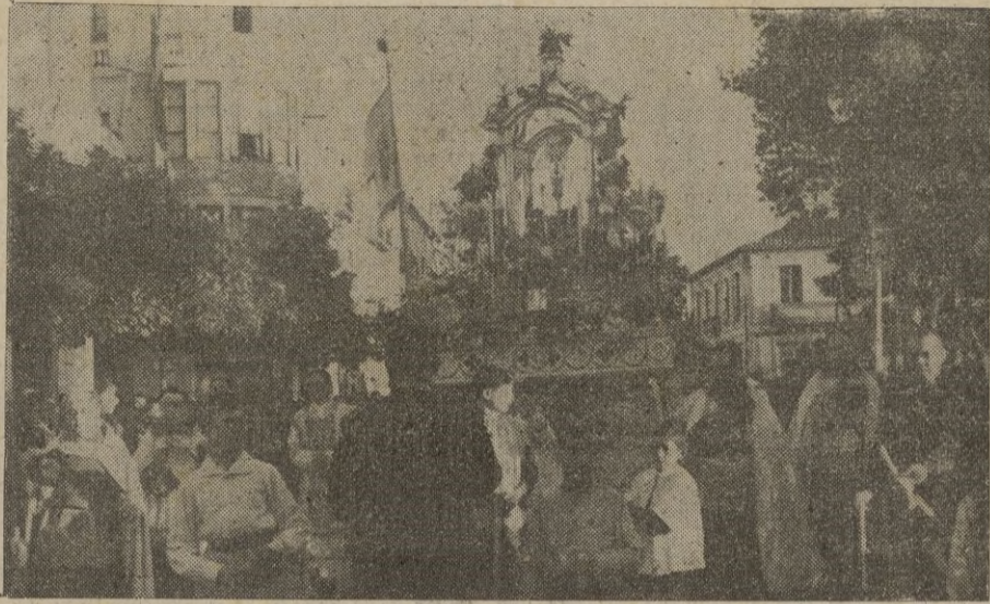
El altísimo, acompañado por el Cabildo Catedral y una enorme multitud a su paso por el Ayuntamiento.