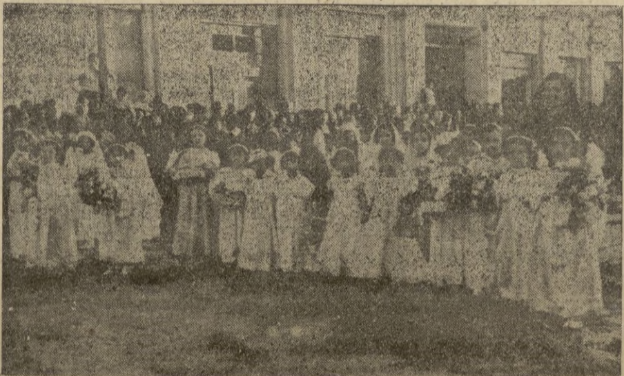
Otro grupo de niñas, -- coro de Angeles -- a su paso frente al Mercado de A bastos.