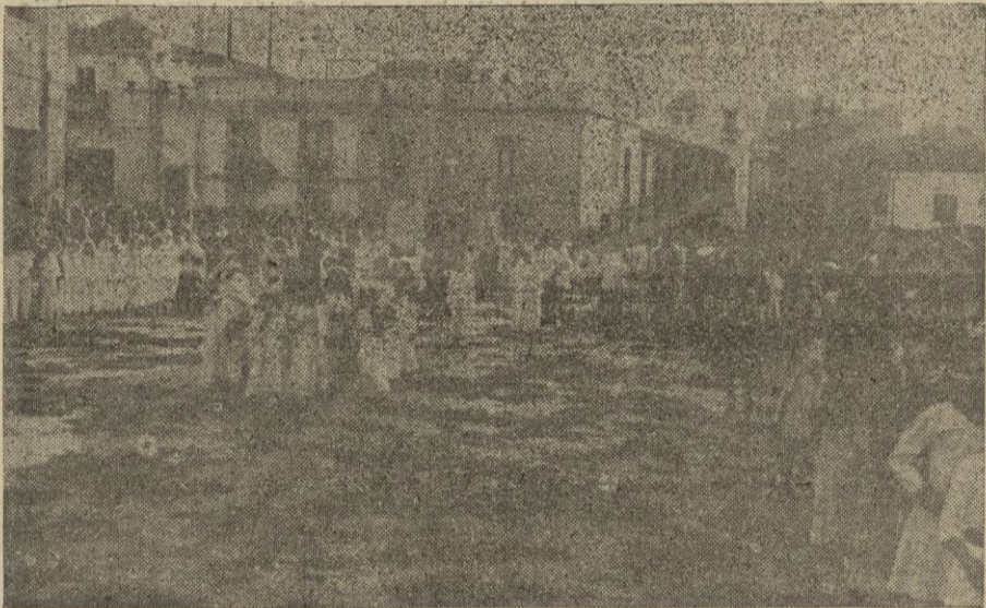
Grupo de niñas de primera comunión a su paso por el Puente de la Almina