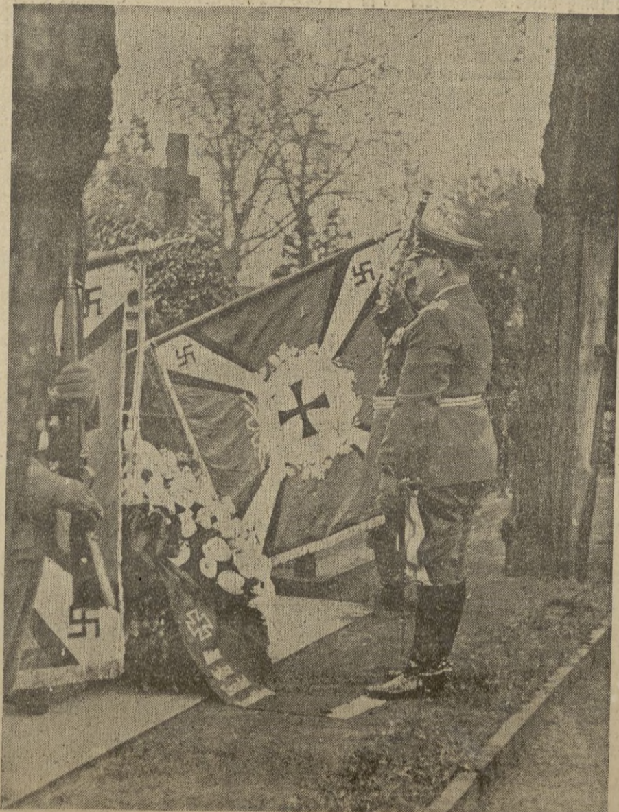
Goering, saluda ante la tumba del aviador Freiherr von Richthofen, que antes de sucumbir gloriosamente, salió victorioso de 80 combates aéreos.

París, 23. (Urgente). — El Gabinete de Guerra ha reunido esta mañana y ha acordado no evacuar la región parisina. — EFE.