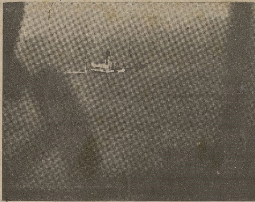
Un buque mercante, alcanzado por una bomba lanzada por un "Stuka" alemán, se hunde en las aguas del Canal.

sultados de algunos distritos de los Estados Unidos del Sur, acusan mayoría aplastante a favor de Roosevelt.