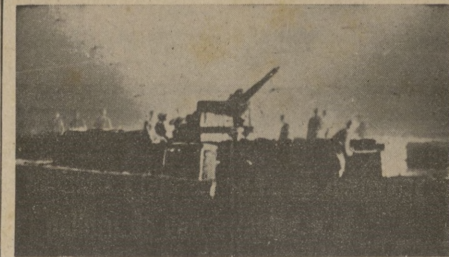
Antiaéreo alemán de grueso calibre rechazando una escuadrilla inglesa que intenta una incursión en la costa del Canal.

Berlín, 5. — Casi al mismo tiempo que los ataques contra el convoy inglés que navegaba hacia el Támesis, un segundo convoy, más pequeño, compuesto por seis barcos, fué atacado por los "Stukas" alemanes. Uno de los vapores de cinco mil toneladas resultó hundido y dos más de cuatro