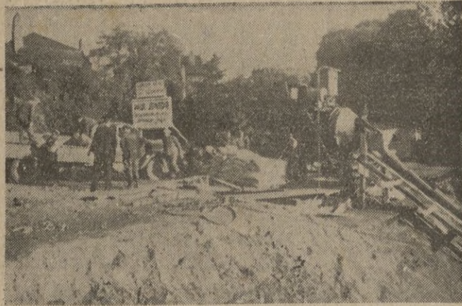
Hombres del Servicio de Trabajo alemán y de la Organización Todt trabajan activamente en las regiones de Lorena afectadas por la guerra.

Y arden los más importantes establecimientos de la industria bélica