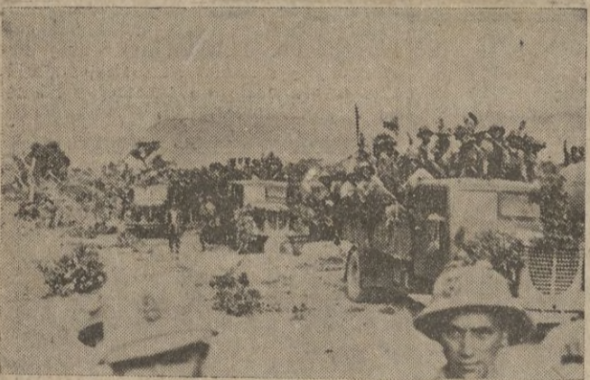
Zeila. -- Una columna de camisas negras, que ocupó la población, en marcha a lo largo de la costa de Berbera.