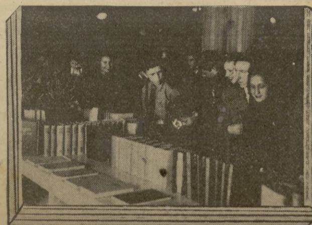
Madrid. — En el Circulo de Bellas Artes se ha celebrado la inauguración de la Exposición del Libro Alemán patrocinada por el Ministerio de Educación Nacional. Figuran 6.000 volúmenes lujosamente editados, valorados en 350.000 pesetas.