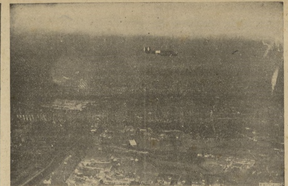
Avión de bombardeo italiano de vuelta de una incursión sobre Londres entra en su base, en el territorio ocupado en las costas de Francia.

Tanto los de guardia, como los libres y los voluntarios, se entregaron con todo el ardor de su acrisolado es-