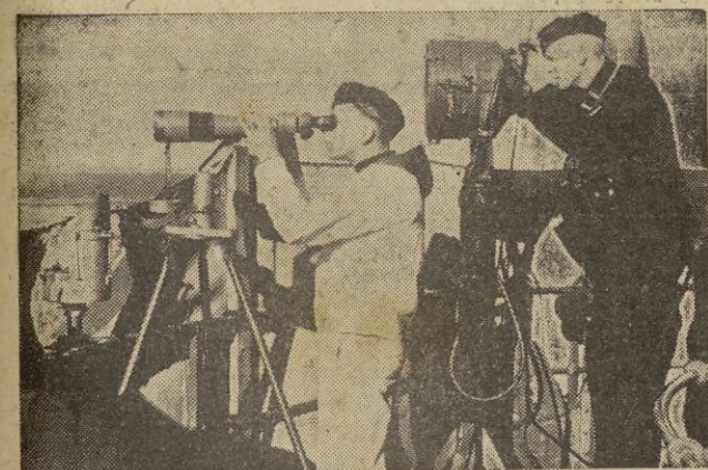
Día y noche prestan los marinos alemanes su servicio, orientando a los barcos y la artillería antiaérea que defienden las costas.