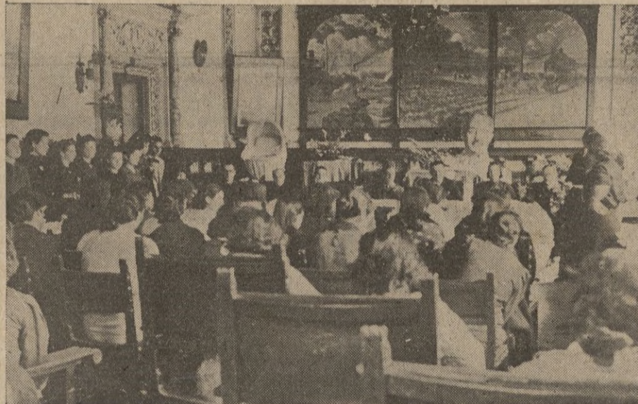
Hermoso aspecto del salón del Hogar de Falange durante el acto de la entrega de cunas y canastillas.

para conseguir esa España que el Ausente y nuestro Glorioso Caudillo, nos han trazado, Una, Grande y Libre. ¡Arriba España!