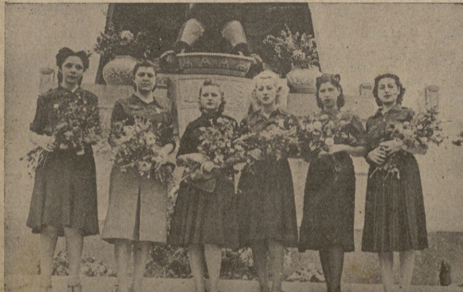
Un grupo de bellas camaradas, ante la Cruz de los Caídos, donde depositaron hermosos ramos de flores, como a cto final de la patriótica "Semana de lucha contra la mortalidad infantil".

Entonces llegará el momento que la Juventud Católica se consagre a reorganizar la sociedad, sobre fundamentos cristianos." — EFE.