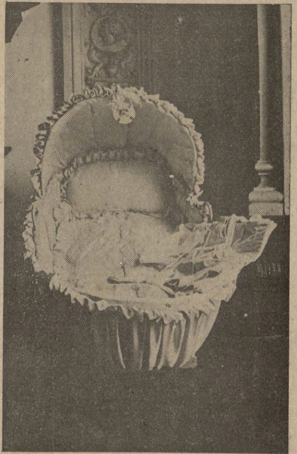
Una de las magnificas canastillas confeccionadas por las camaradas falangistas, y donadas a las madres carentes de recurso para los cuidados de sus pequeños.