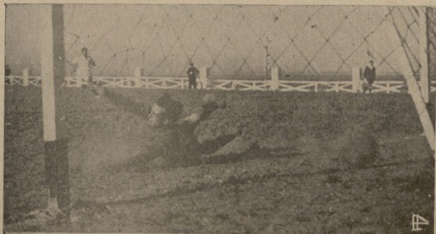
(1) Una de las felices intervenciones de guardameta del C. D. Marruecos, en el partido celebrado ayer. - (2) y (3) Los equipos del C. D. Marruecos y Ceuta Sport que se enfrentaron en partido amistoso. (4) El primer gol del Marruecos, obra de Diestro al lanzar un fault contra el Ceuta. F. Guadarrama