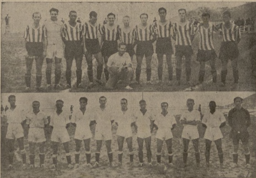
El Africa y el Tehad Riadi, conforme se alinearon en el partido del domingo en el Stadium Municipal.