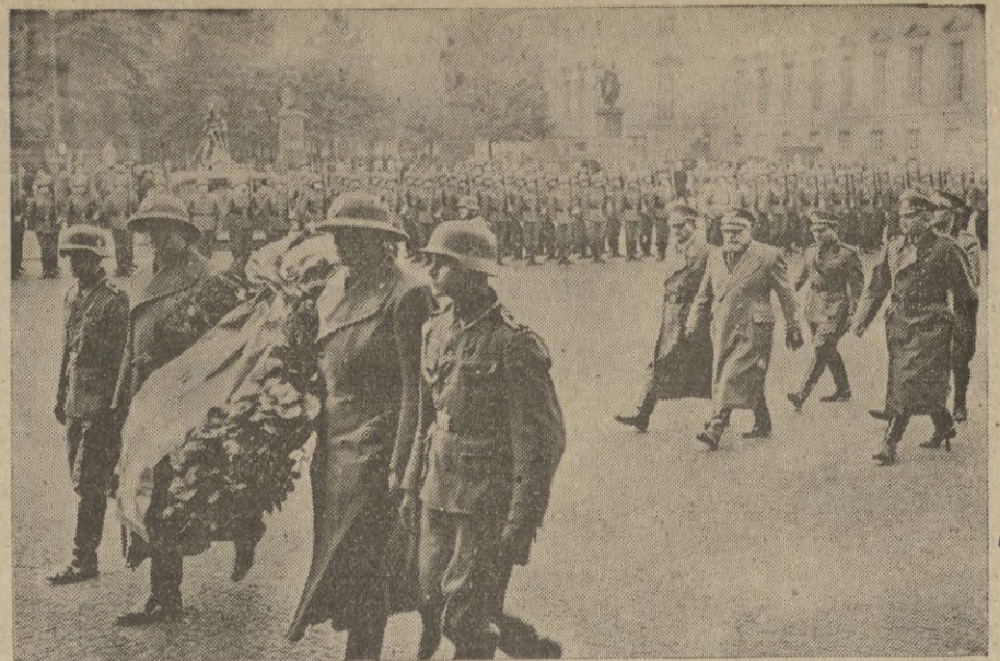
El Ministro de las Colonias italiano, General Teruzzi, con motivo de su visita a Berlín, depositó una corona en el Monumento de honor a los Caídos

El Presidente del Consejo, Oliveira Salazar, ha dirigido una alocución a los Oficiales del Batallón, antes de marchar éste.