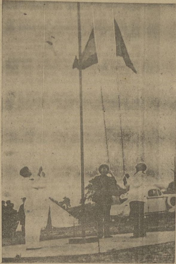
El momento de arriar las enseñas de la Patria. Firmes los flechas, mientras que las Banderas del Movimiento y la Nacional flotan al viento y bajan arriadas por nuestras Autoridades y Jerarquías.

LA MARCHA Y FUNCIONAMIENTO DE ESTE CAMPAMENTO. HORARIO. ACTIVIDADES. CRUZ DE LOS CAIDOS. EVOCACION.