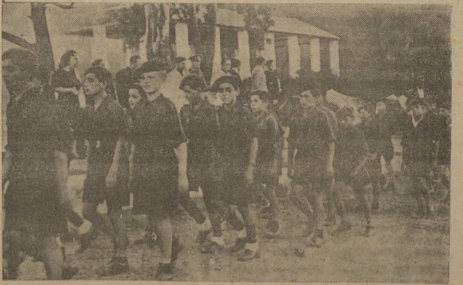
La juventud, los futuros soldados del Imperio, desfilan marciales, delante de las Autoridades y Jerarquías. En cada uno de ellos, un español, y en cada español un pensamiento: ¡Patria!