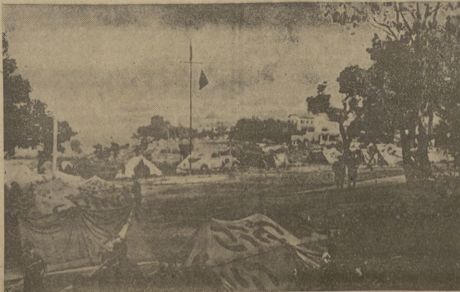
Vista panorámica del Campamento "5 de Agosto de 1936". Al fondo, Ceuta, ojos cariñosos que miran al Campamento, y frente a él, el mar que fué testigo del hecho glorioso que dió nombre a este campamento