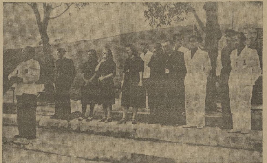
Las Autoridades, Jerarquías, e invita dos a la inauguración, escuchando las palabras que el Jefe de Prensa y P propaganda dirige a los acampados.