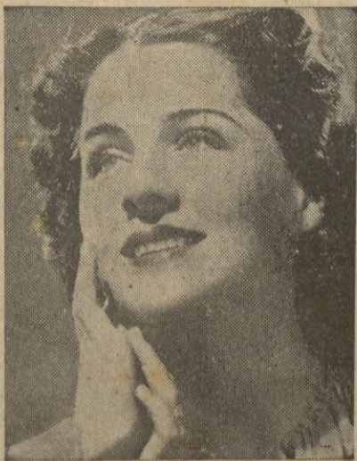
NORMA SHEARER la gentil "Julieta" de la película ROMEO Y JULIETA próxima a estrenarse.

Londres, 10. — La quinta alarma ha sido dada en la región londinense, a las 19 horas, catorce minutos. — EFE.