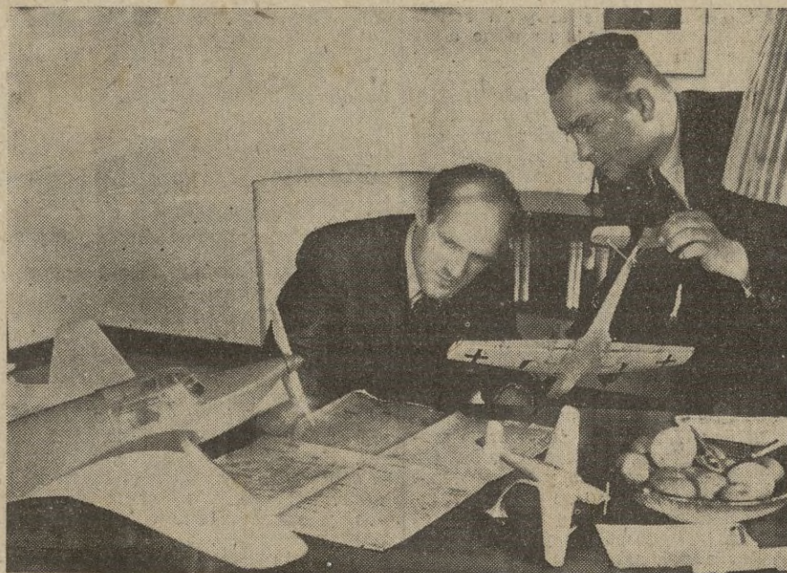
El profesor Messerschmidt (sentado), constructor de más de un centenar de tipos de aviones que llevan su nombre, estudia con un ingeniero los detalles de un nuevo modelo.

Según los delitos cometidos se les condena, por lo menos, a dos libras, o catorce días de prisión. Todos eligen la reclusión ya que de esta manera quedan imposibilitados para seguir navegando. — CIFRA.