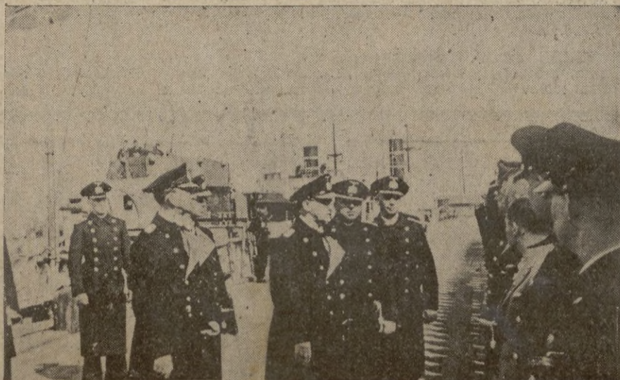
El Gran Almirante Raeder felicita a la tripulación de una unidad ligera que se distinguió especialmente por su actuación en el mar.

Acompañan al señor Serrano Súñer el Embajador de España en Berlín, señor Espinosa de los Monteros y la mayoría de los miembros que componen su séquito. — EFE.