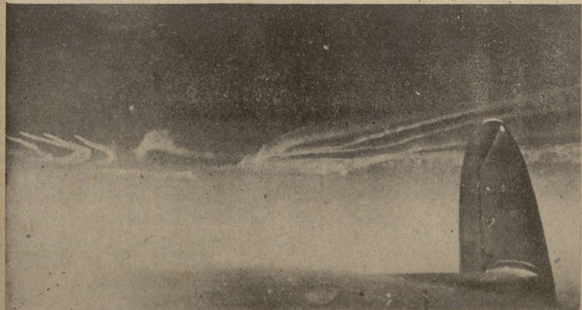
Destructores protectores lanzando estelas de humo

El mar es navegable, pues en toda la zona del Canal reina calma casi absoluta. — EFE.