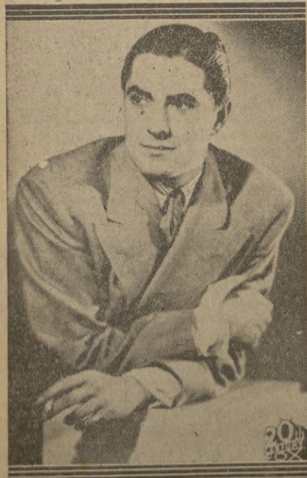
TYRONE POWER el indiscutible galán de moda, protagonista de la película "Lloyds de Londres"