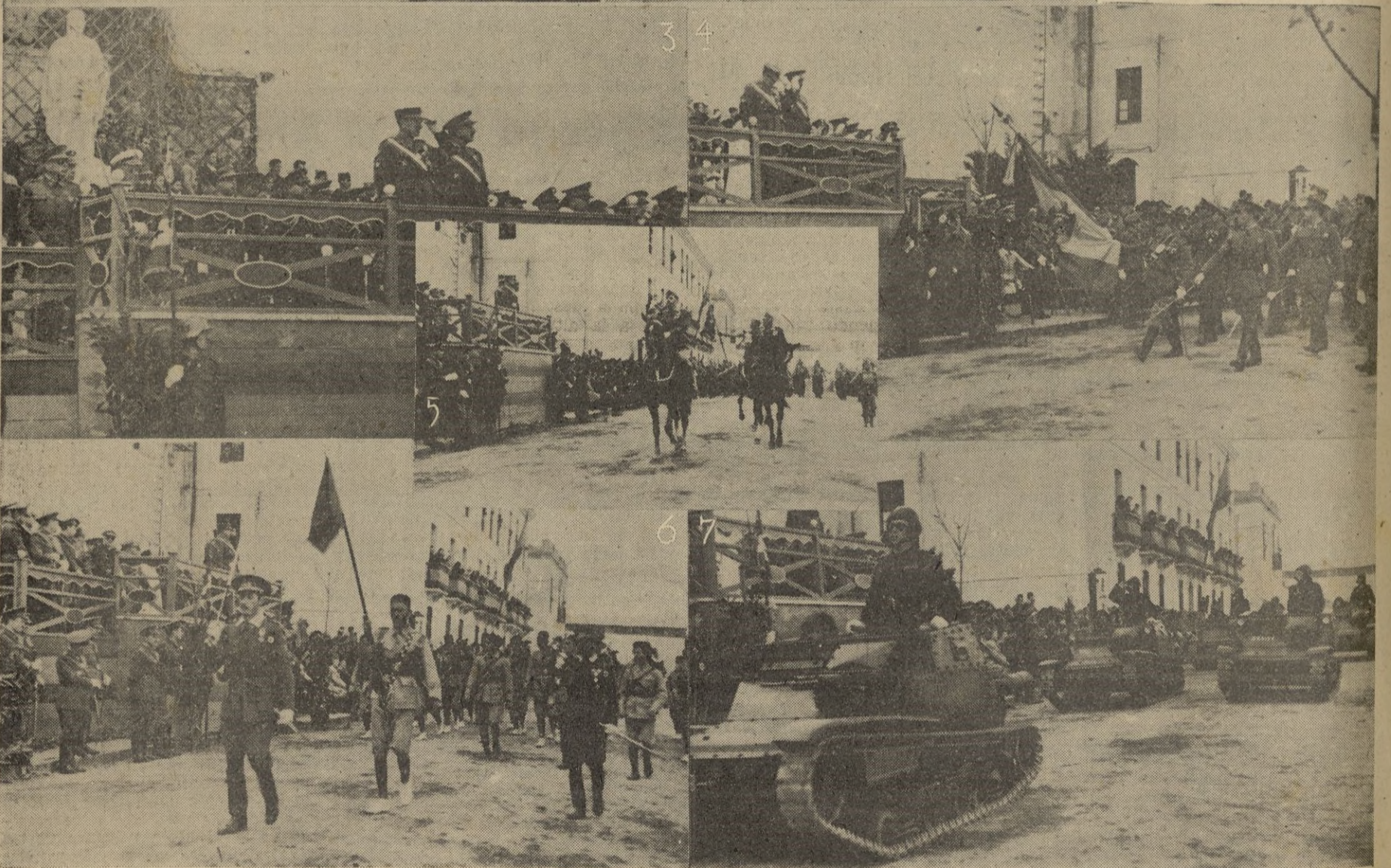
3, 4, 6 y 7