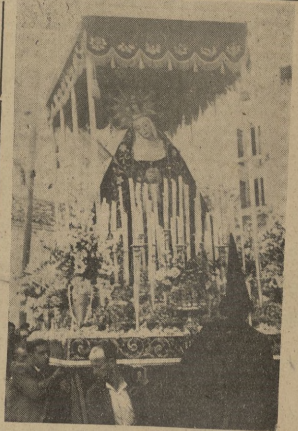
Algunos de los pasos que figuraron en la procesión de ayer